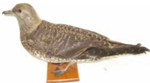
› Kleinste Jager Stercorarius longicaudus , juveniel (verzameld te Molenbeersel, Limburg, augustus 1958), Gemeentehuis Weert, 5 september 2005 (Justin Jansen). Uit de collectie Kiggen.