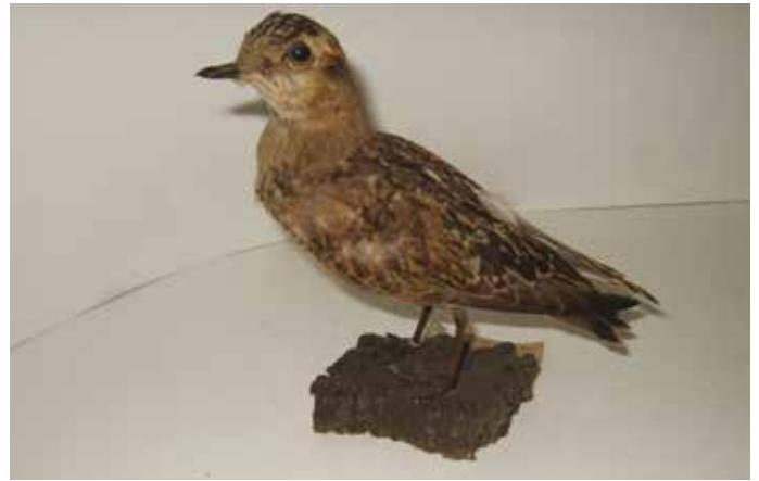
▶ Morinelleplevier Charadrius morinellus , juveniel, (verzameld te "Schelde", Antwerpen, in juli 1938), Gemeentehuis Weert, 5 september 2005 (Justin Jansen). Uit de collectie de Blicck.

Jules Desideratus De Blicck geboren op 4 september 1895 in Antwerpen en gestorven op 8 februari 1960 in Wijnegem, was een bekend ornitholoog. De Blicck verzamelde voornamelijk rond Antwerpen, maar kocht ook vogels van andere verzamelaars zoals Van Laethem uit Hoboken. De Blicck publiceerde vooral over zeldzame vogels en over vogeltrek, zowel in Wielewaal als in De Giervalk ( Gerfaut ). In de uit 142 vogels bestaande verzameling bevonden zich diverse bijzondere soorten zoals: Alpenheggenmus Prunella collaris (mannetje, Antwerpen, 2 januari 1932) ( Gerfaut 22 (3); 135-136), Kortteenleeuwerik Calandrella brachydactyla (Hoboken, 20 november 1943 & Wijnegem, november 1914), Papegaaiduiker Fratercula arctica (ten noorden van Doel langs de Schelde, 22 december 1950) ( Wielewaal 17; 90), Siberische Taling Anas formosa (vrouwetje, Sinaai januari 1931) ( Giervalk 1939; 171), Dwergooruil Otus scops (Stembert,