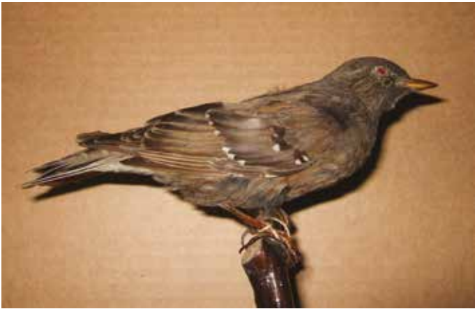
▶ Alpenheggenmus Prunella collaris , adult mannetje (verzameld te Antwerpen, 2 januari 1932), Gemeentehuis Weert, 5 september 2005 (Justin Jansen). Uit de collectie De Blicck.