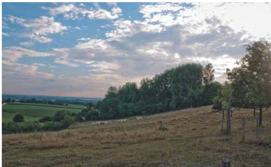
^^ Geelgors ^ Vergezicht

exact de grens tussen droog en nat Haspengouw, tussen panoramische akkerlanden en glooiende boomgaarden. De noordzijde ademt romantiek: hoge fruitbomen of hoogstammen staan er in eeuwenoude perkjes die keurig omzoomd zijn met meidoornhagen.