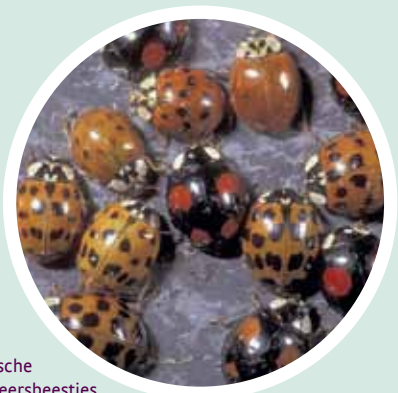
Aziatische lieveheersbeestjes