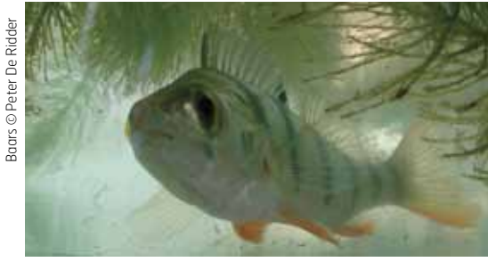
Boors © Peter De Ridder