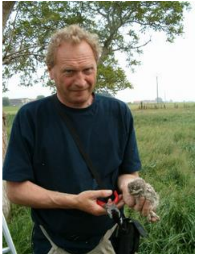
Ludo ringt een jonge Steenuil