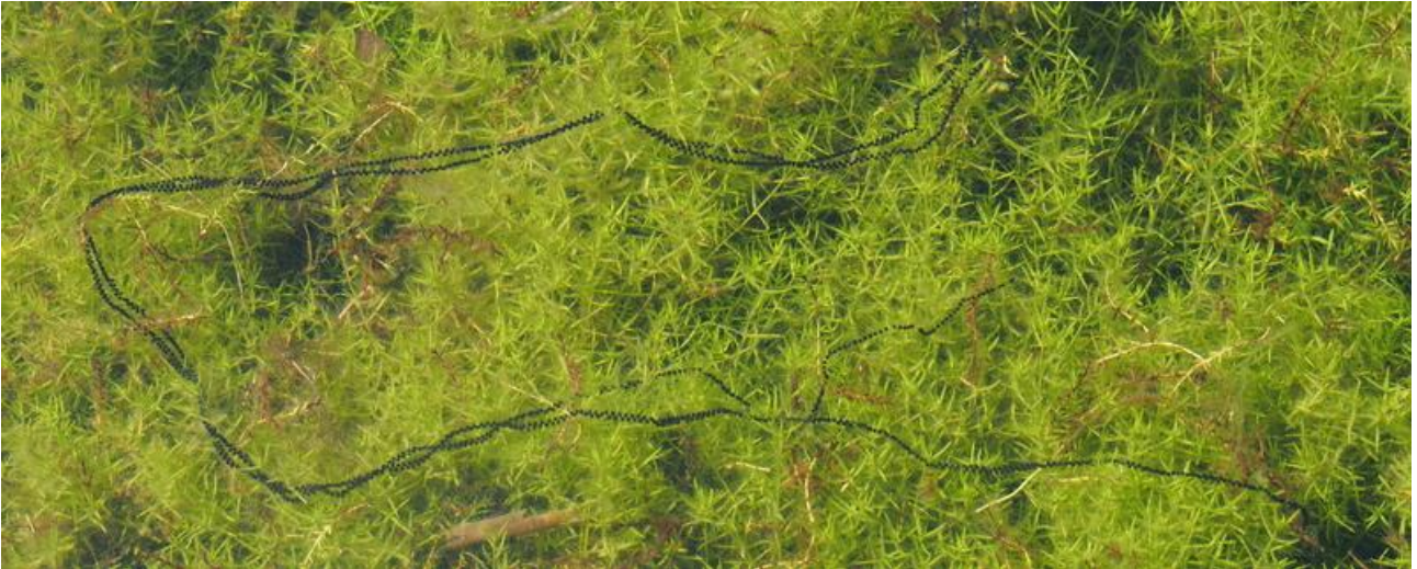
Figuur 1: Eisnoer van de Rugstreeppad. Het merendeel van de eieren is nog gepaard, maar lokaal is het snoer reeds 'ontdubbeld'.

Ook de larven van Rugstreeppadden lijken sterk op die van de Gewone Pad (gitzwart van kleur), maar zijn kleiner (1,5 tot 2,5 cm lang). Als ze reeds groot genoeg zijn, is een lichtgekleurde driehoekige vlek achter de mond waarneembaar (onderzijde). Zij vervolledigen hun metamorfose gewoonlijk binnen één maand tijd, afhankelijk van de temperatuur van het water.