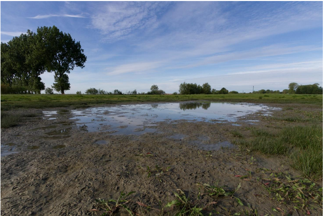
Figuur 3: Voortplantingswater van de Rugstreepad.