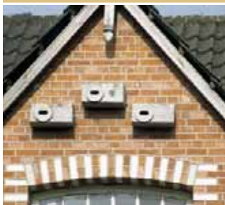
Nestkasten in houtbeton