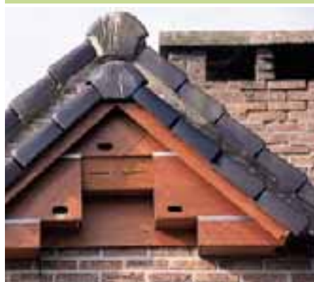
Nestkasten in hout