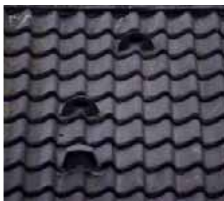
Nestpannen voor Gierzwaluw

gedicht) waardoor op één jaar tijd kolonies met een paar tientallen koppels kunnen verdwijnen. Wat dan gedaan?