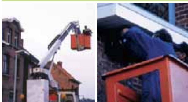
Nestbakken plaatsen met de hoogtewerker

Voor algemene inlichtingen en informatiepakketten over de Gierzwaluw kan u terecht bij: