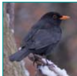
MEREL (man) 23,5-29 cm zwart met gele of bruine bek