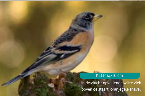
KEEP 14-16 cm In de vlucht opvallende witte vlek boven de staart, oranjegele snavel