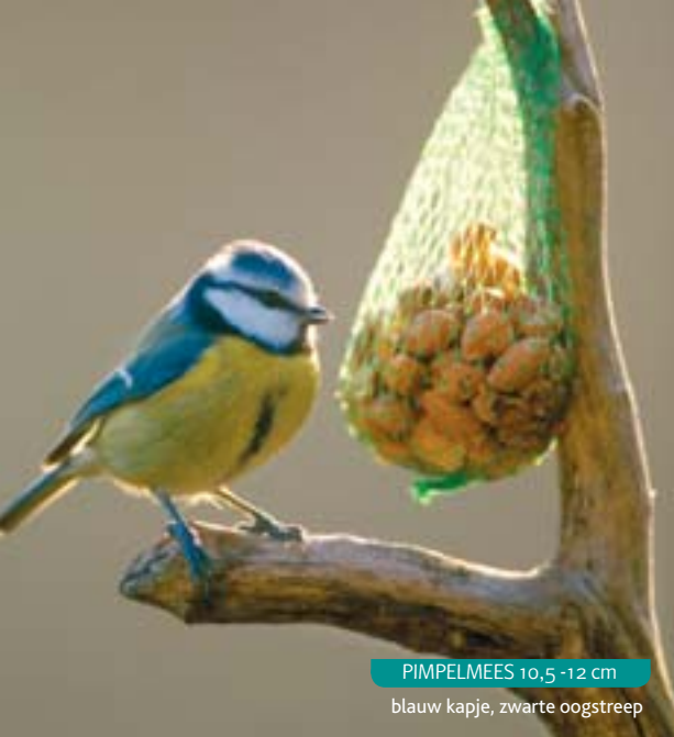
PIMPELMEES 10,5 - 12 cm blauw kapje, zwarte oogstreep