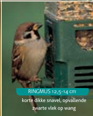
RINGMUS 12,5-14 cm korte dikke snavel, opvallende zwarte vlek op wang