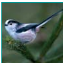
STAARTMEES 13-15 cm

grootte van een mus, veel wit in vleugel