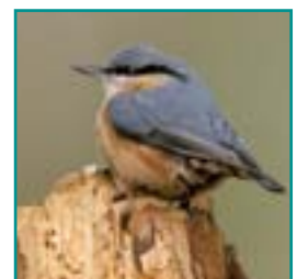
BOOMKLEVER 12-14,5 cm

Kleine bruine mees met opval- lende kuif, bewoont naaldbos