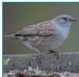
HEGGENMUS 13-14,5 cm bruin gestreepte borst, grijze kop, onopvallend rondscharrelend op de grond