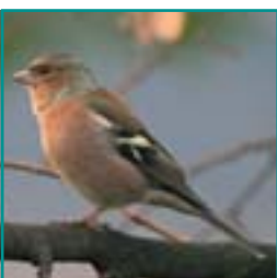
VINK 14-16 cm

grootte van een duif, lichtbruin met blauw in vleugel