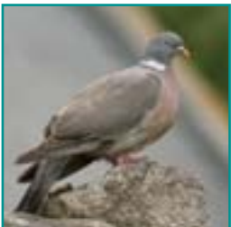
HOUDUIF 38-43 cm dikke duif met opvallende witte halsring en witte vleugelbanen