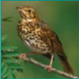
ZANLIJSTER 20-22 cm

warm bruine rug en kop, borst wit met pijlpunt vlekken