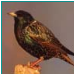
SPREEUW 19-22 cm

korte dikke snavel, grijsbruin zonder opvallende kleur