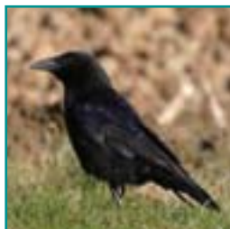
ZWARTE KRAAI 44-51 cm

zwarte kop en hals, veel wit op borst en vleugel, lange staart