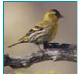
SJJS 11-12,5 cm kleine vinkensoort met lichte, gestreepte borst en zwart en geel in de vleugel