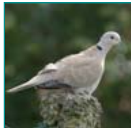
TURKSE TORTEL 31-34 cm vaalbruin duifje met zwarte halsring