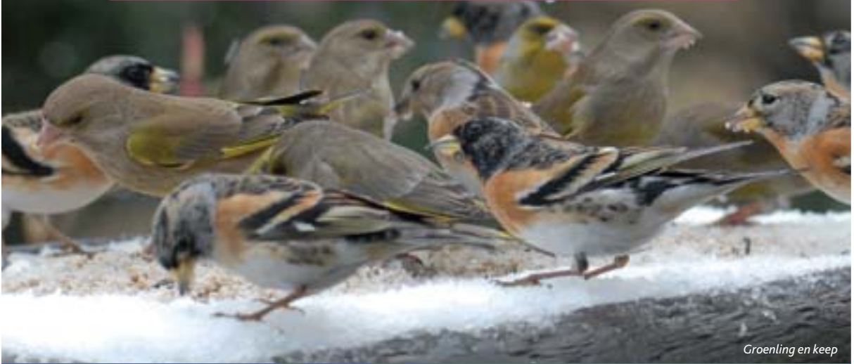
Groenling en keep

In het weekend van 7 & 8 februari 2009 organiseert Natuurpunt, met de steun van Tom & Co en Animal Center Tom&Co, opnieuw een nationaal telweekend van tuinvogels. Vorig jaar telden bijna 7600 gezinnen mee. Voeder jij deze winter ook je tuinvogels en tel je mee?