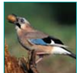
GAAI 32-35 cm

in groepjes en met opvallend grijze hals