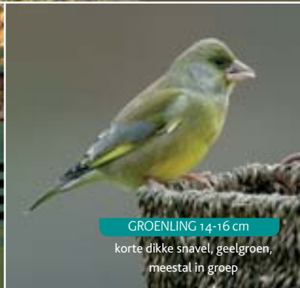
GROENLING 14-16 cm korte dikke snavel, geelgroen, meestal in groep