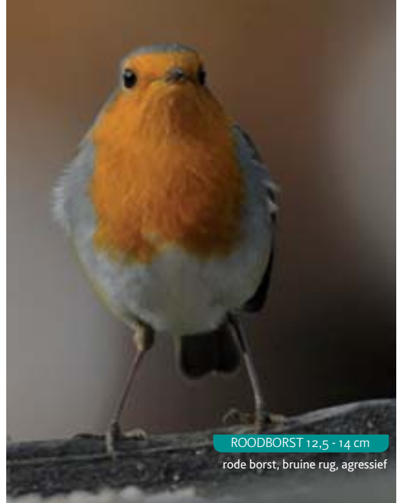
ROODBORST 12,5 - 14 cm

Donker, opvallende witte vlek op achterhoofd