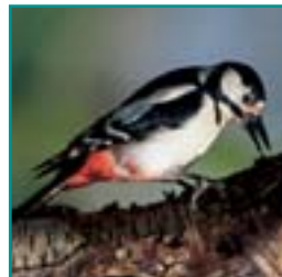
GROTE BONTE SPECHT ± 25 cm witte wang, veel wit in vleugel, opvallend rode onderstaartdekveren