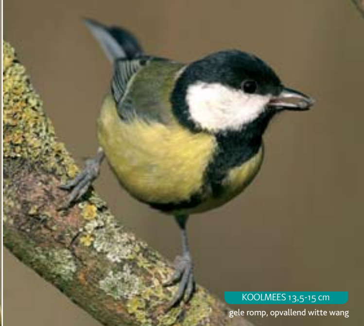
KOOLMEES 13,5-15 cm gele romp, opvallend witte wang