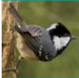
ZWARTE MEES 10-11,5 cm

warm bruine rug en kop, borst wit met pijlpunt vlekken