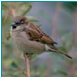
HUISMUS 14-16 cm

korte dikke snavel, grijsbruin zonder opvallende kleur