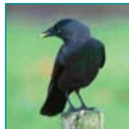
KAUW 30-34 cm

Grote volledig zwarte vogel grote snavel