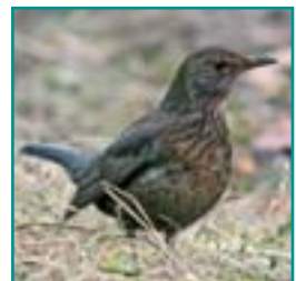
MEREL (vrouw) 23,5-29 cm bruin met oranje of bruine snavel, borst is bruingrijs en nooit wit