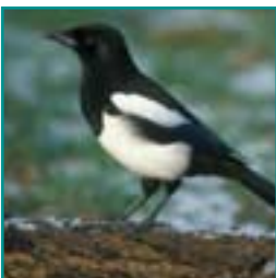
EKSTER 40-51 cm

zwart met gespikkelde borst en rug, vaak in groep