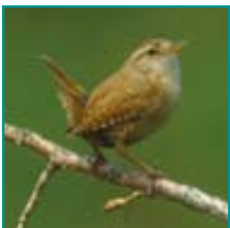
WINTERKONING 9-10,5 cm snel, zenuwachtig vogeltje met opstaande staart