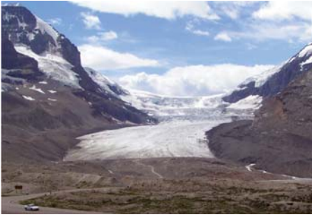
Gletsjers smelten op meerdere plaatsen verspreid over de wereld

De klimaatverandering op regionaal niveau beïnvloedt reeds vele natuurlijke systemen. Bijvoorbeeld, sneeuw en ijs smelten af en de bevroren ondergrond is in toenemende mate aan het ontdooien, hydrologische en biologische systemen zijn aan het veranderen en worden soms verstoord, migraties beginnen vroeger en de geografische verspreidingsgebieden van de soorten verplaatsen zich richting polen.