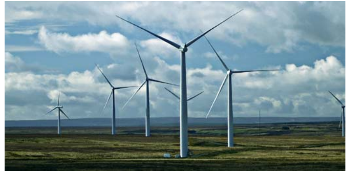
Hernieuwbare energie is een middel voor reductie van de emissies

Beperkende maatregelen kunnen de samenleving nog andere voordelen opleveren, zoals besparingen in de ziektekosten ingevolge de verminderde luchtvervuiling. Maar een beperking in één land of een groep landen zou elders kunnen leiden tot een hogere uitstoot of een invloed hebben op de globale economie.