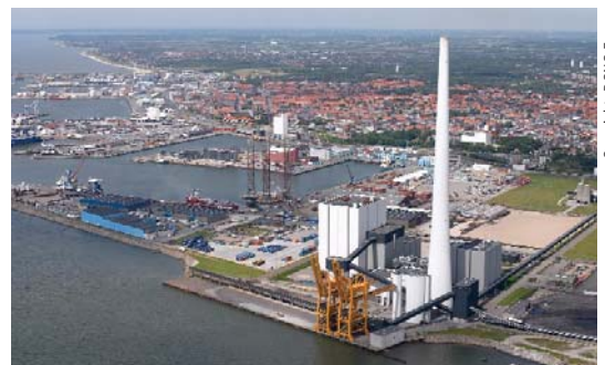
De Esbjerg energiecentrale in Denemarken, waar opvang van koolstofdioxide wordt toegepast.

Het overschakelen naar meer duurzame ontwikkeling kan een belangrijke bijdrage vormen tot de beperking van de klimaatverandering. Beleidsvormen die bijdragen tot zowel de beperking van de klimaatverandering als tot duurzame ontwikkeling omvatten diegene die verband houden met energiedoelmatigheid, hernieuwbare energiebronnen en het behoud van natuurlijke