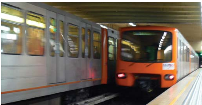
Publiek transport kan de emissie van broeikasgassen helpen verminderen

Veranderingen in levensstijl en gewoontes die het behoud van natuurlijke bronnen bevorderen, kunnen bijdragen tot beperking van de klimaatverandering.