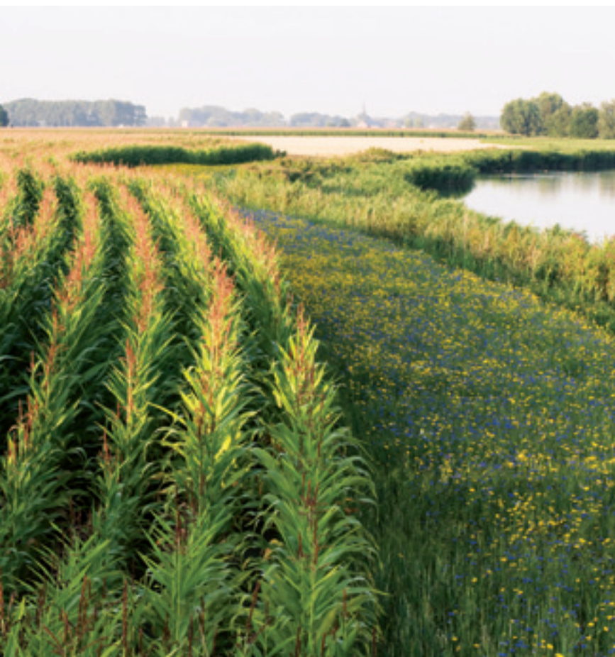
Maisakker afgezoomd met een ecologische akkerland.

Maar dit systeem is toe aan evaluatie. Sommige maatregelen blijven zonder resultaten hoewel ze al verschillende jaren worden ingezet. Zo zijn de beheerovereenkomsten voor weidevogels in de huidige vorm weinig succesvol. Het heeft geen zin publiek geld te blijven besteden aan maatregelen die geen extra natuurwinst opleveren. Pakketten voor akkervogels garanderen wel goede resultaten en het blijft dan ook zinvol om die beheerovereenkomsten te behouden in het nieuwe landbouwbeleid.