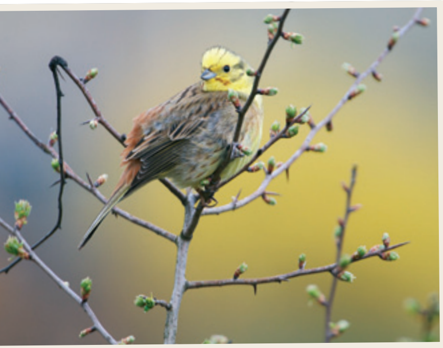
De geelgors is een typische akkersoort.

die varieert tussen 100 en 150 euro. Voor het onderhoud van een bestaande haag krijgt hij 1,5 euro per meter.