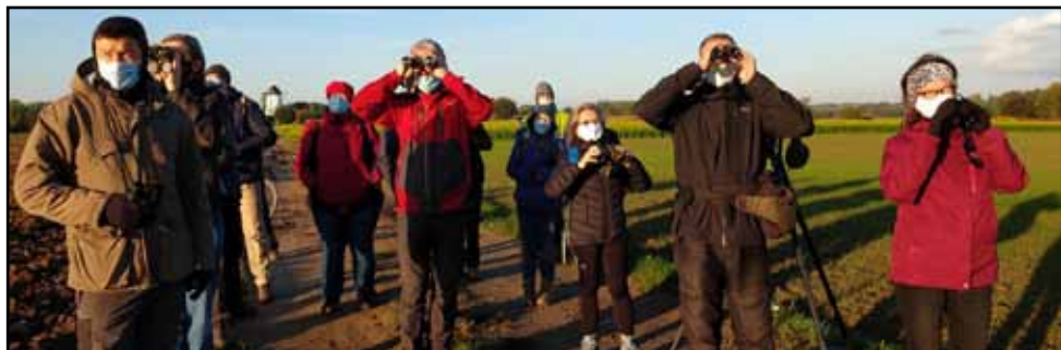
Trekvogels spotten

laten voor wat hij is en met zijn geïnteresseerde debutanten naar de Makegemse bossen te wandelen. Daar zijn nog interessante dingen te zien en te vertellen.