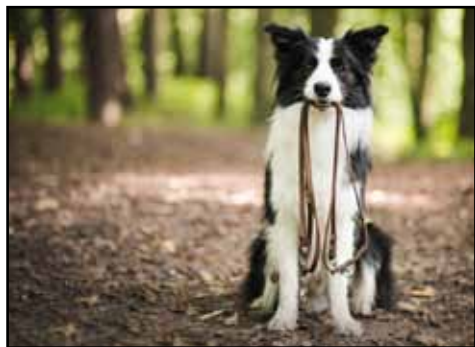
Hond aan de leiband

•Zo moeten dieren met alle gepaste middelen worden vastgehouden en minstens met een korte leiband, op iedere plaats van de openbare ruimte en in galerijen en passa-