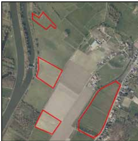
Aankopen in Merelbeke

Uiteraard wensen we het weidebeheer, in samenwerking met een lokale landbouwer, op deze percelen ook in de toekomst