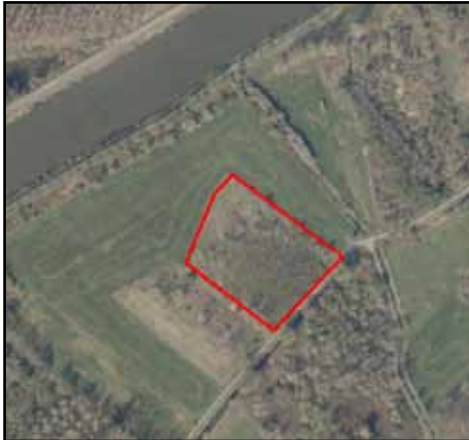
Aankopen in Melsen

In Melsen konden we een eerste perceel aankopen op het voormalige stort. Dit stort werd eind vorige eeuw afgedekt met een dikke grondlaag en is intussen deels opgeschoten als bos of in beheer als weiland. Natuurpunt kon een deel van het bos aankopen. Deze aankoop is een weloverwogen keuze alhoewel deze niet voor de hand lag. Op onze toekomstige wandelingen gaan we graag verder in op de opportuniteiten en hoe we hier ook natuurdoelen willen realiseren.