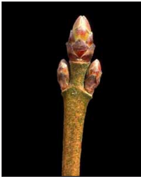
Knop van een veldesdoorn