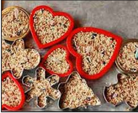
Hartjes voor de vogels

kel, kerstman), een rietje, natuurtouw en kokosvet en gemengd vogelvoer. Smelt het kokosvet of frituurvet in een