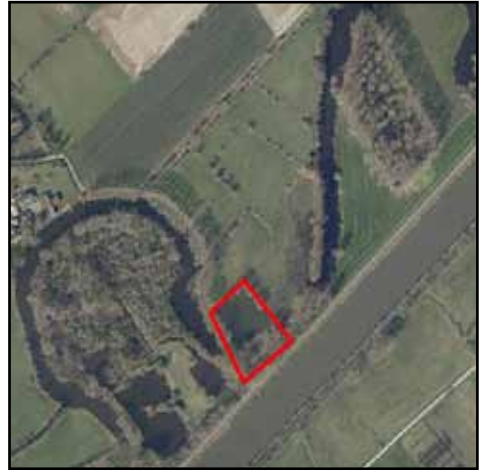
Aankopen in Zevergem

wanden en troebel water wordt omgevormd tot een vegetatierijke poel met afgeschuinde oevers waar plas-dras-flora zich optimaal thuis voelt en een natuurlijk visbestand kan floreren.