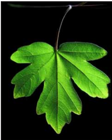
Blad van een veldesdoorn