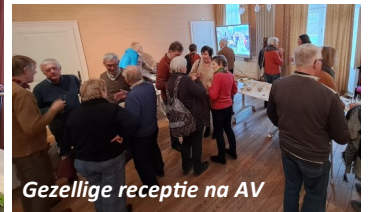
Gezellige receptie na AV