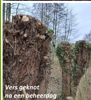
Vers geknot na een beheerdag