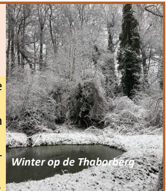
Winter op de Thaborberg

Wat de schrijvers ons wel leren is dat Natuurpunt hier in Dilbeek gerust nog mag groeien . Met 1 lid van Natuurpunt op 69 inwoners zitten we onder de 1 op 46 in Vlaanderen. Ook qua grondbezit is er een inhaalbeweging te maken. Want met 0.24% eigendom zitten we hier duidelijk (8 keer!) onder de 2% die aangehaald wordt in de artikels. Iemand dus eens een lidkaart van Natuurpunt bezorgen, is een waar topcadeau. Of meehelpen met groene natuur te verwerven (of te onderhouden) is heus geen misdrijf. Kortom, meer groen zodat De Ridder, gezeten op zijn elektrische fiets, de ravissant mooie Sneeuwwitje niet in een woonwijk maar wel terug in de natuur kan gaan zoenen ... (DT)