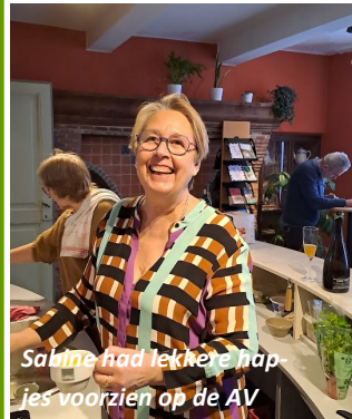
Saline had lekkere hapjes voorzien op de AV