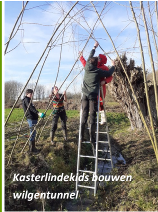
Kasterlindekids bouwen wilgentunnel