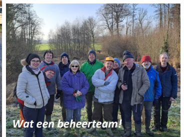
Wat een beheerteam!