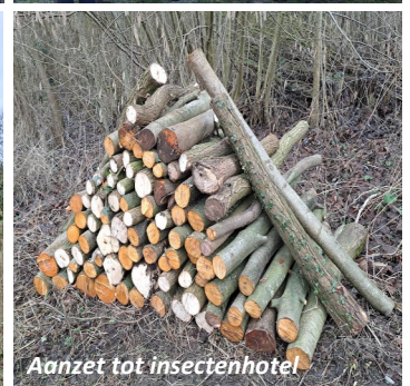
Aanzet tot insectenhotel