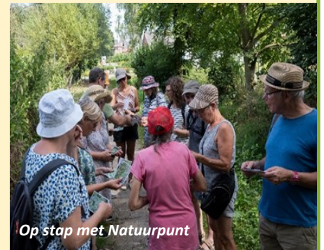
Op stap met Natuurpunt

jes, gemaakt door leden van Natuurpunt. De volledige presentatie inclusief heel wat mooie foto's is beschikbaar op onze site onder de rubriek 'Nieuws', https://www.natuurpunt.be/afdelingen/natuurpunt-dilbeek . Ga zeker eens een kijkje nemen. (FR)