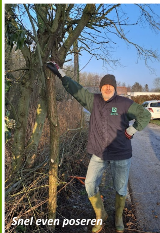
Snel even poseren