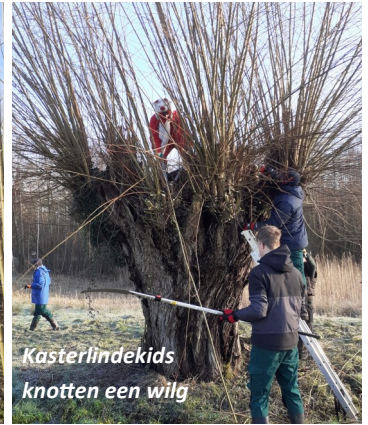
Kasterlindekids knotten een wilg