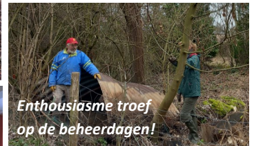
Enthousiame troef op de beheerdagen!