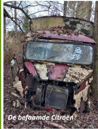
De befaamde Citroën