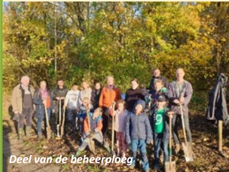
Deel van de beheerploeg