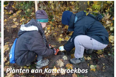
Planten aan Kattebroekbos