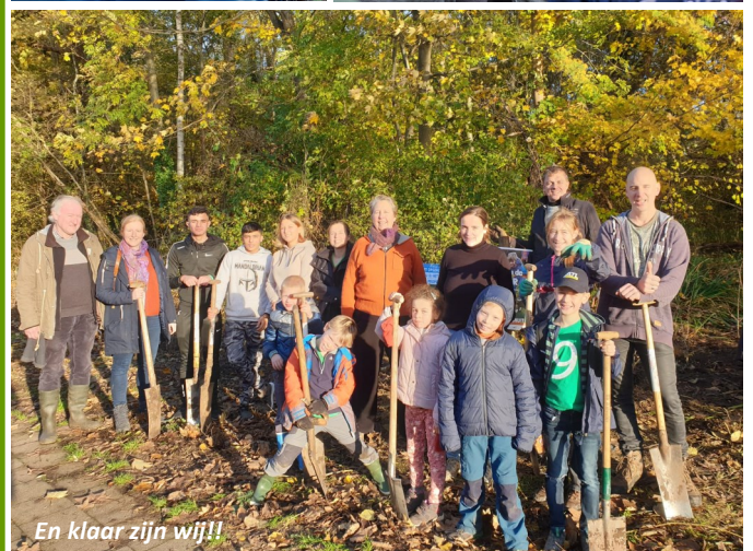
En klaar zijn wij!!