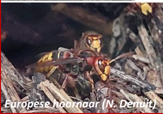
Europese hoornaar (N. Denuit)