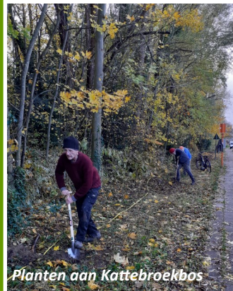
Planten aan Kattebroekbos