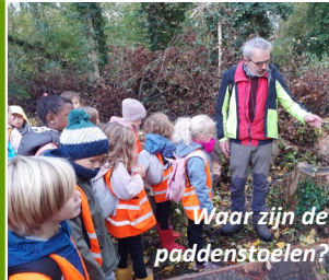
Waar zijn de paddenstoelen?