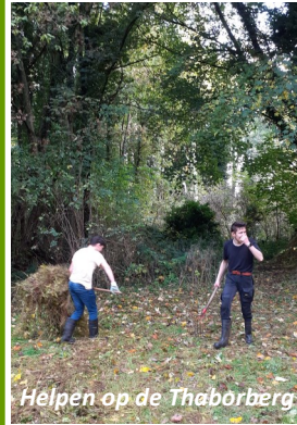
Helpen op de Thaborberg