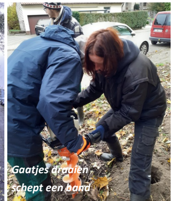
Gaatjes draaien schept een band