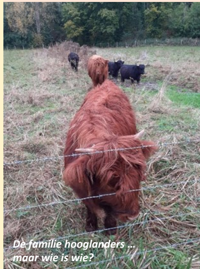
De familie hooglanders ... maar wie is wie?