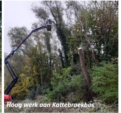
Hoog werk aan Kattebroekbos