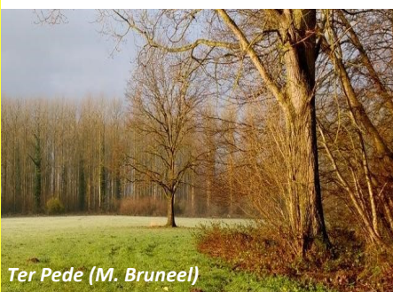
Ter Pede (M. Bruneel)

We laten elke maand via mail, onze site, facebook en whatsapp weten waar we de handen uit de mouwen zullen steken, en waar we afspreken. Hopelijk tot snel! (ED en FR)