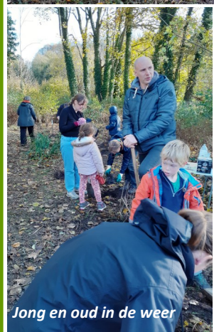
Jong en oud in de weer