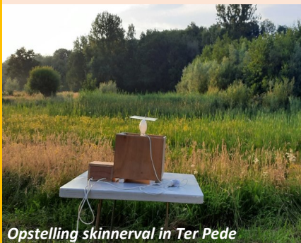
Opstelling skinnerval in Ter Pede

Ter Pede is een relatief jong natuurgebied, en dat blijkt onmiddellijk wanneer je de eerste waarneming bekijkt. Ze dateert van 23 mei 2011, een witte kwikstaart . Jarenlang werd er weinig waargenomen en daar had het gebrek aan gevarieerde vegetatie zeker iets mee te maken. De laatste jaren kwam er wel duidelijk schot in de zaak en werden tal van hiaten opgevuld. Het project Pajottenmotten gaf het aantal waarnemingen voor dit gebied een duidelijke boost. Tot begin januari werden er in Ter Pede 844 verschillende soorten waargenomen, waarvan 246 nachtvlinders. Begin december 2022 was dit aantal opgekrukt tot 1077 soorten , waarvan 383 nachtvlinders. Er vielen leuke uitschieters te noteren onder de nachtvlinders zoals: viervlakvlinder , blauwvlekkaartmot , prachtpurperuiltje , gevlamde uil , gestippelde rietboorder , zwartvlekspikkelspanner ,