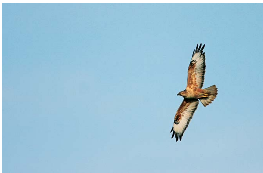
Arendbuizerd Buteo rufinus cirtensis . imm. 25 okt 2008. Doel (O)

steld. Het gaat trouwens veelal om waarnemingen uit het najaar.