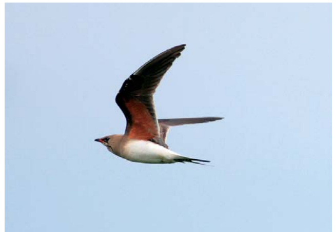
Vorkstaartplevier Glareola pratincola . ad. zomer. 22 jun 2008. Bredene

(6) 22 juni – 25 juni: Bredene (W), 1 ad. (verslag Miguel Demeulemeester)