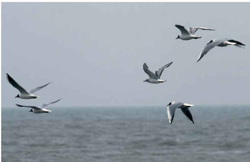
Kleine Kokmeeuw Larus philadelphia . 1ste zomer. 8 jun 2008. Sint-Idesbald

(1) 6 januari: IJzermonding, Nieuwpoort (W), 1 ad. (verslag Peter Adriaens)