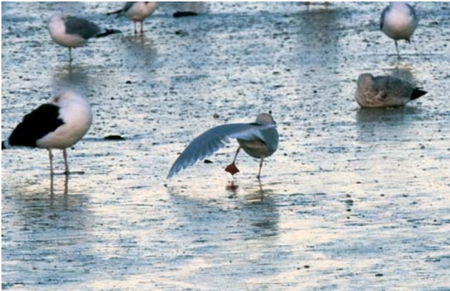
Kumliens Meeuw Larus glaucooides kumlienii . ad. (centraal op de foto) 6 dec 2008. Nieuwpoort