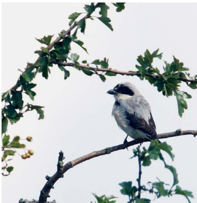
Kleine Klapekster Lanius minor . ad. 20 jul 2008. Opheers (L)