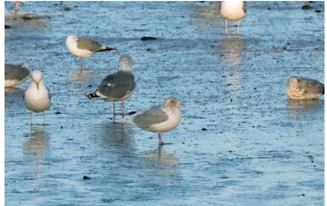
Kumliens Meeuw Larus glaucooides kumlienii . ad. (centraal op de foto) 6 dec 2008. Nieuwpoort

Het eerste Belgische geval van deze ondersoort wordt nader beschreven in Adriaens (2008). De taxonomische status van Kumliens meeuw is enigszins wazig: een ondersoort van Kleine Burgemeester Larus glaucooides , een hybride populatie tussen Kleine Burgemeester en Thayers Meeuw Larus thayeri of een aparte soort. Onderzoek naar de exacte taxonomie wordt bemoedigd door de afgelegen broedgebieden in oostelijk Arctisch Canada (Olsen & Larsson 2003, Adriaens 2008).