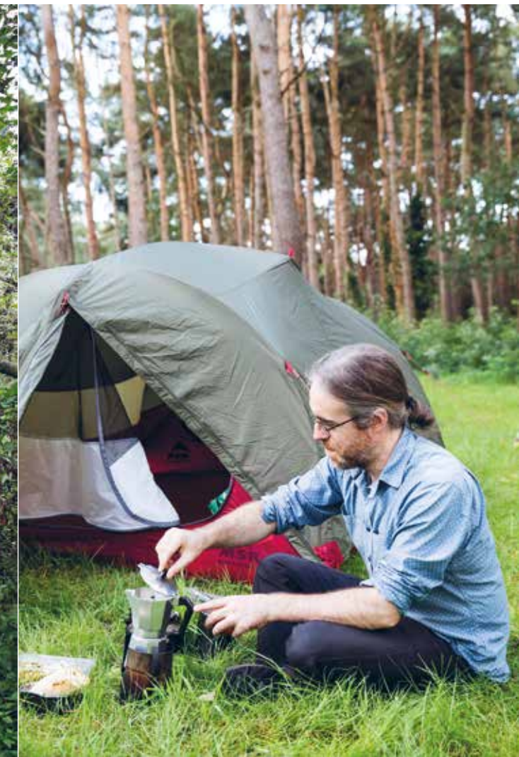
Even een kop koffie voor ik aan de tocht begin.