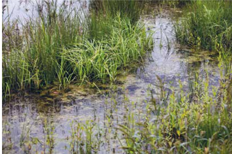
Het Grote Netewoud gaat van droge heide tot zompige moerassen.