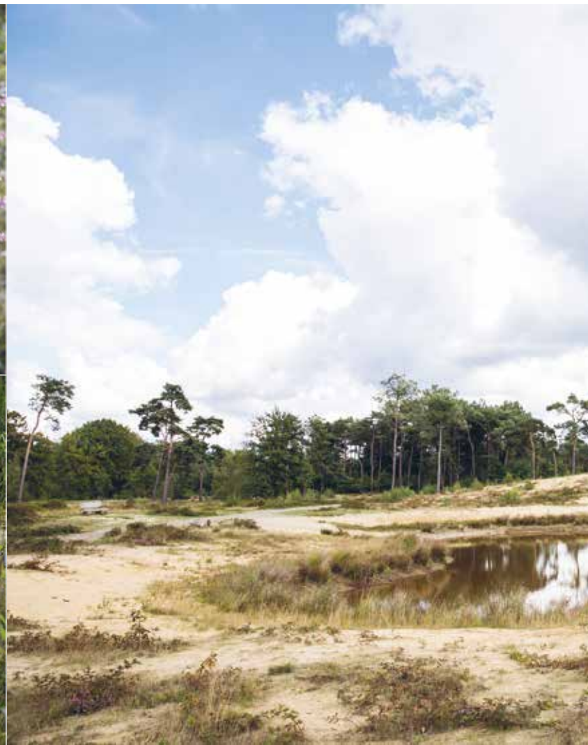
Tussen de zandduinen kan je als wandelaar heerlijk uitwaaien...