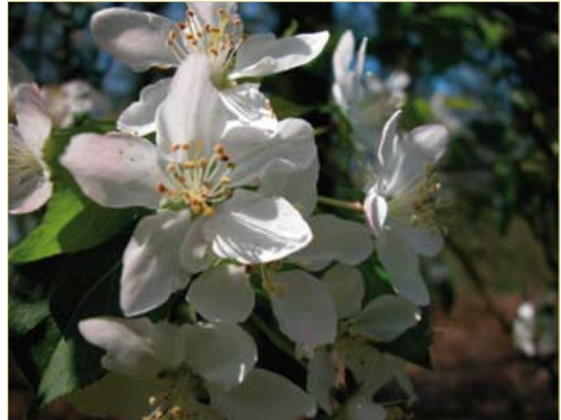
Figuur 2. Witte bloemen kenmerken Wilde appel te Eibergen, Nederland.

de, door iepen gedomineerde Zalkerbos staat een hybride van Wilde appel (Weeda et al. 1987). Interessant zijn de vermeldingen van verordeningen om allerlei stekelstruiken, waaronder Wilde appel, te sparen vanwege hun nut om pas ontkiemde eiken te beschermen tegen vraat (Vera 1997)