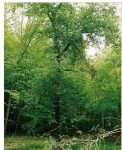
Figuur 7. Een vrijgestelde Wilde appel in het Meerdaalwoud groeit krachtig uit tot een boomhoogte van 23 meter.