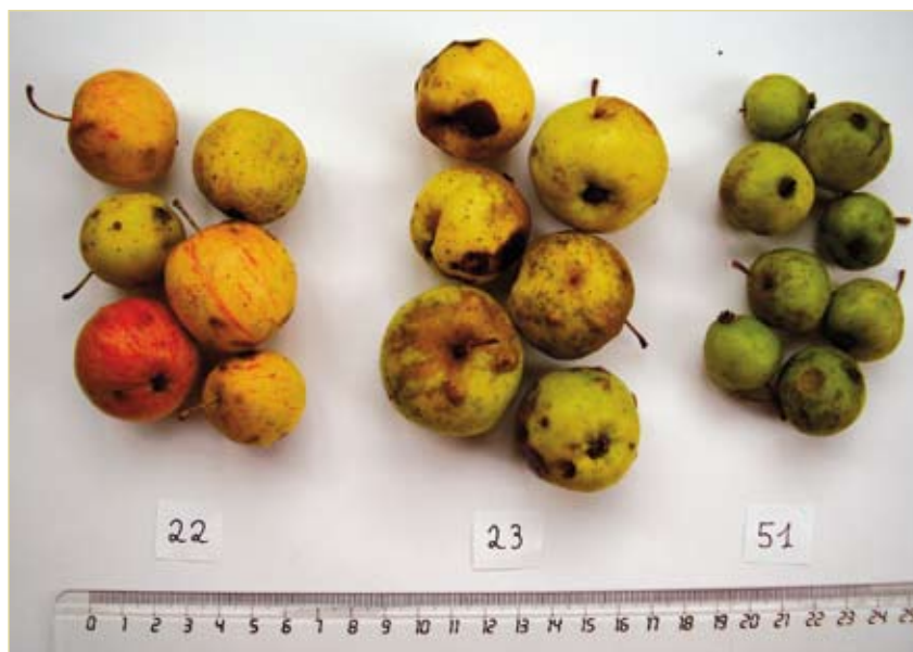
Figuur 3. Genetisch zuivere Wilde appels met geel tot groene schil (nummers 23 en 51) en een genetische hybride met rode streepjes (nummer 22).