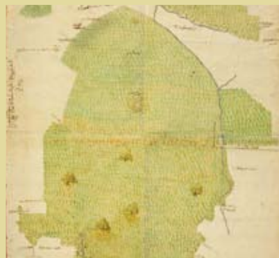
Figuur 5. Laat zestiende-eeuwse kaart van het Meerdaalwoud (Algemeen Rijksarchief Brussel; Baeté 2007)