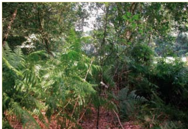
Figuur 9. Aanplant van autochtoon plantsoen op de Duivelsberg (omgeving Nijmegen, Nederland) door Staatsbosbeheer.