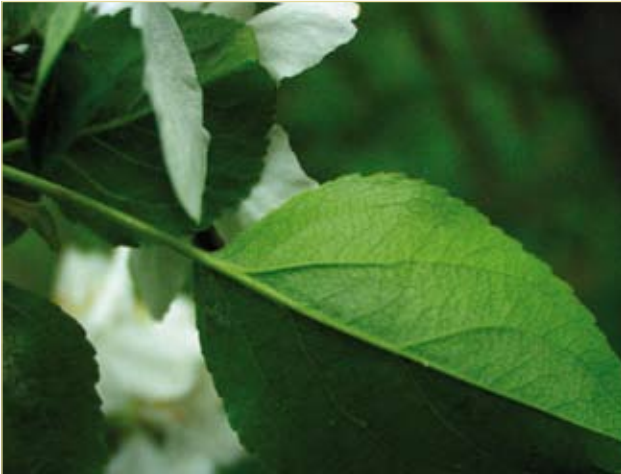
Figuur 1. De licht behaarde tot onbehaarde onderzijden van het blad wijzen op Wilde appel.