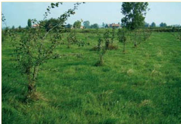
Figuur 8. Aanplant van genetisch zuivere Wilde appels te Dentergem. Hier worden appels geplukt voor de productie van bosplantsoen.