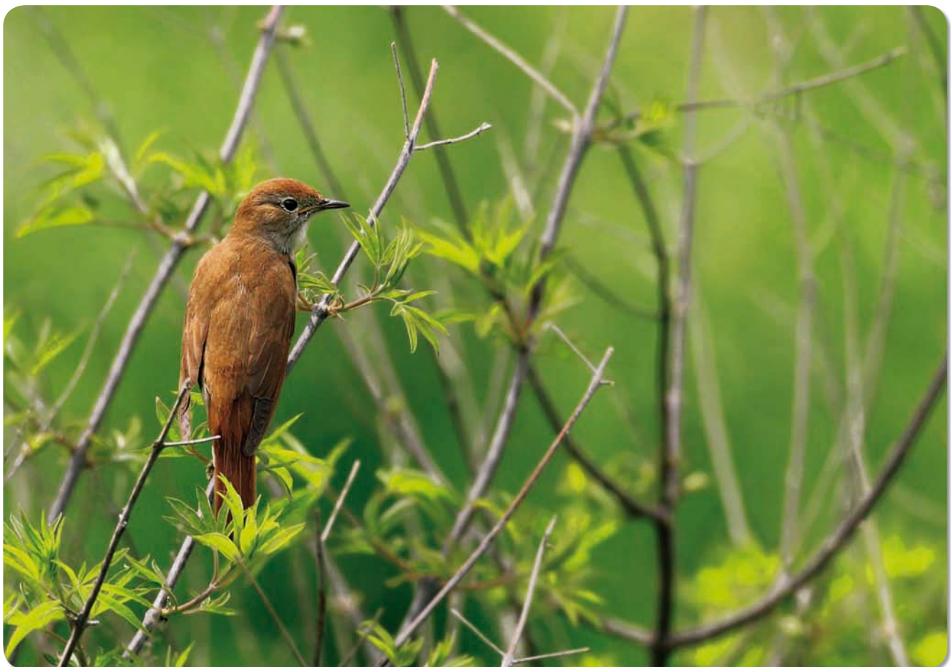
De Nachtegaal was de eerste vogel die in België wettelijke bescherming genoot

Dit eerste artikel in de reeks Biodiversiteit in Vlaanderen 2010 gaat in op de maatschappelijke en sociaal-culturele aspecten van het natuurbehoud. Vanuit de invalshoeken visie & drijfveer en structuur & draagvlak analyseert deze bijdrage de evolutie van het Vlaamse natuurbehoud. In een eerste luik komen de verscheidenheid aan oude en nieuwe visies en drijfveren aan bod die sturend waren voor het natuurbehoud. De meer recente ontwikkelingen die het natuurbehoud zijn huidige vorm gegeven hebben, zijn te vatten onder de noemer structuren en draagvlak.