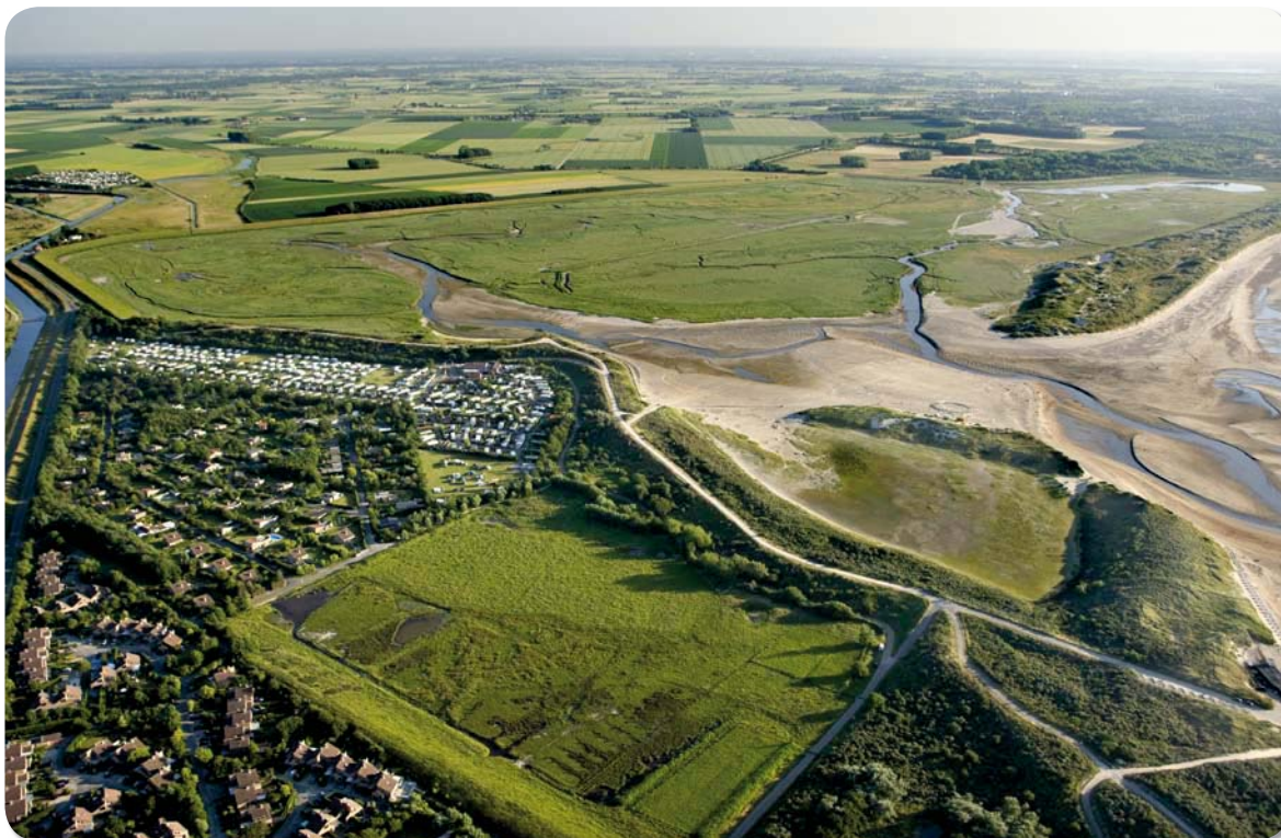
De Zwinvlakte was een van de eerste private natuurreservaten in België. Nadat het in 2006 werd aangekocht door het Vlaams gewest, zal het verder uitgebreid worden in het kader van de Scheldeverdragen.