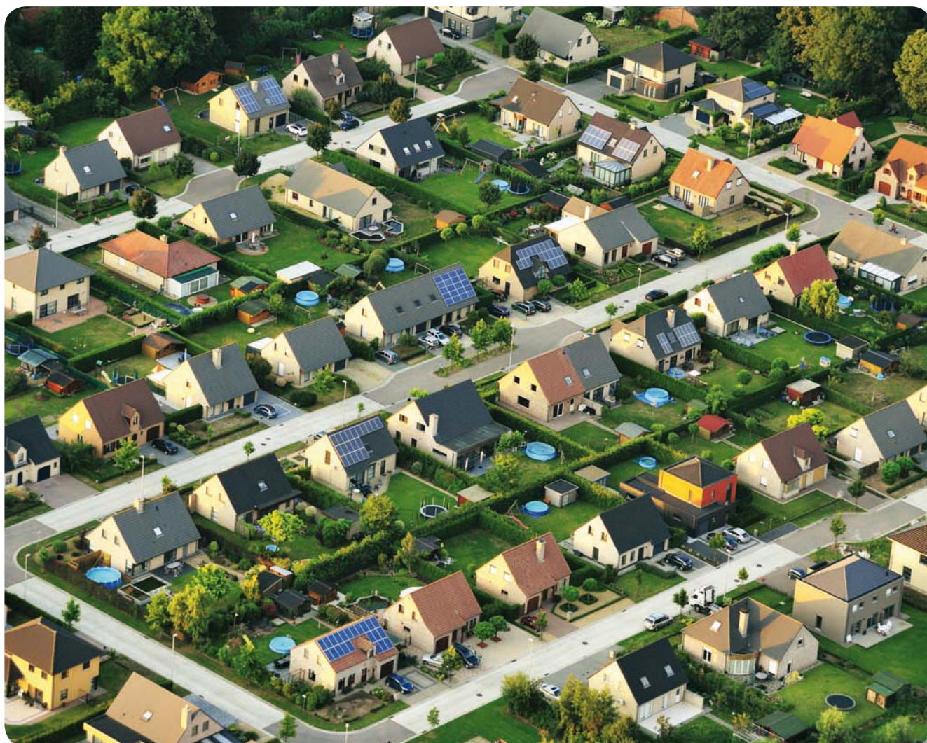
2010: Vlaanderen in transitie naar klimaatadaptatie en 'groene' economie. Het credo 'huisje/tuintje/auto' wordt ingeruild voor 'huisje-met-zonnepanelen/tuintje-met-zwembad/elektrische auto'. Quid biodiversiteit?

2010 is het Internationaal Jaar van de Biodiversiteit. De vaststelling dat de achteruitgang van de biodiversiteit niet gestopt is, maakt van 2010 een scharnierjaar om de inspanningen op te voeren. Niet enkel meer, maar ook andere en betere. In deze context wil de redactie met een speciale artikelenreeks de toestand, de uitdagingen en de oplossingen voor natuurbehoud en biodiversiteit in Vlaanderen een heel jaar tegen het licht houden.