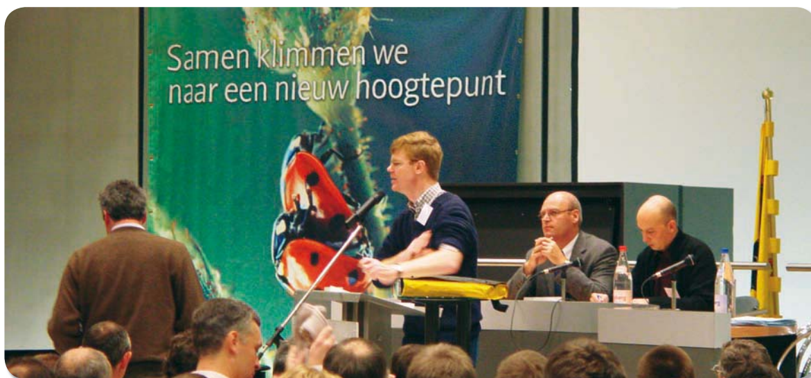
Het startcongres van Natuurpunt vzw op 8 december 2001 in de Schelp van het Vlaams Parlement. Natuurpunt ontstond door een fusie van Natuurreservaten vzw en De Wielewaal vzw.

in het INBO, het Instituut voor Natuur- en Bosonderzoek. Het aantal medewerkers nam toe van een half dozijn in de jaren 1980 tot ruwweg 270 vandaag. Naast professionele onderzoekers bleven ook vrijwilligers actief op het vlak van natuurstudie en in het bijzonder het verzamelen van natuurhistorische en veldbiologische gegevens. De taakverdeling tussen alle actoren is tot vandaag een punt van discussie en overleg (Wiering et al. 2001).