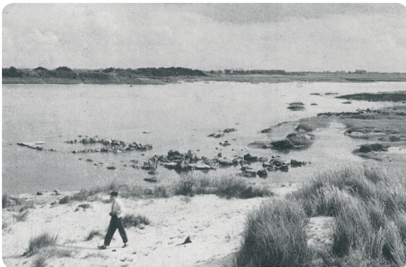
De monding van het Zwin tijdens de springvloed van 1955.