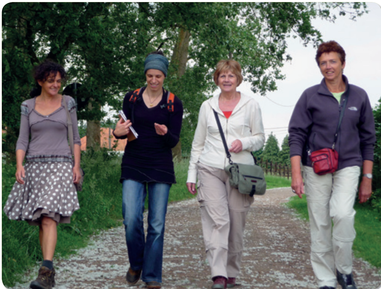
Stilte wandelingen spreken een vrouwelijk publiek aan.

Volgens het Van Dale woordenboek is natuurbescherming vrouwelijk. Maar is dat in de praktijk ook zo? Vrouwen zijn sterk ondervertegenwoordigd in de bestuursorganen van natuurverenigingen. Ook blijken vrouwen significant minder deel te nemen aan sommige activiteiten van de natuurverenigingen. Dat is het meest opvallend bij natuurbeheer en natuurstudie. Dat staat dan weer in contrast met de pioniersrol die vrouwen tijdens de belle époque en zelfs nog in het interbellum gespeeld hebben in het ontstaan van de natuurbeweging en in het bijzonder de verenigingen voor vogelbescherming. Kampt de natuursector met een eigen genderprobleem? En zo ja, wat kunnen we eraan doen?