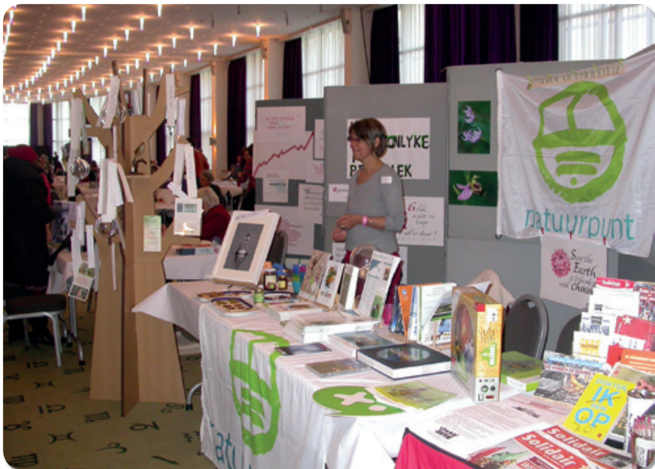
Infostand van Natuurpunt Educatie op de 41ste Vrouwendag in Oostende.