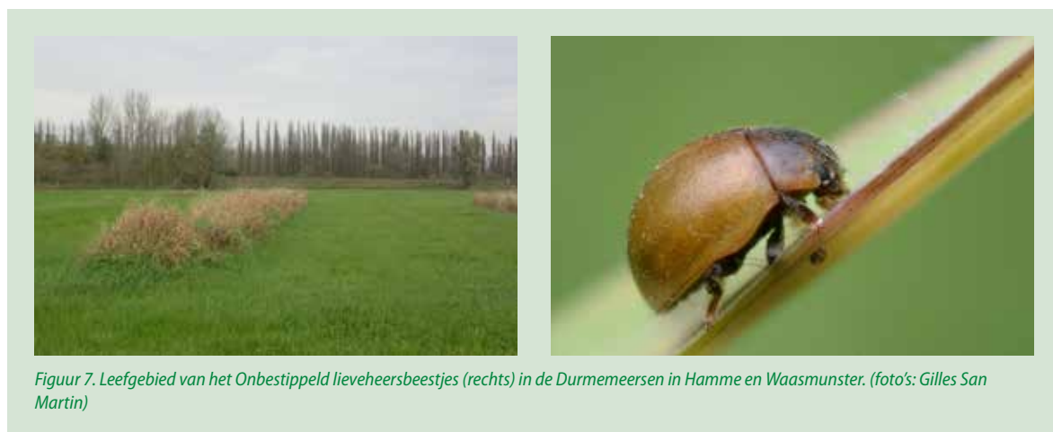
Figuur 7. Leefgebied van het Onbestippeld lieveheersbeestjes (rechts) in de Durmemeersen in Hamme en Waasmunster.

Kennis over specifieke beheermaatregelen voor lieveheersbeestjes is schaars. Algemeen is het behoud van belangrijke habitats voor lieveheersbeestjes zoals moerassen, graslanden en heidegebieden met een warm microklimaat van groot belang. Stedelijke en randstedelijke gebieden kunnen zeer rijk aan lieveheersbeestjes zijn, zowel in diversiteit als in aantallen (Figuur 8). In de stad is het vaak net dat graadje warmer en komen wellicht ook meer ziekten en plagen voor op allerlei bomen en planten, die op hun beurt dan weer bladluizen en andere prooien van lieveheersbeestjes aantrekken. In steden kan specifiek aandacht verleend worden aan (relict) populaties van zeldzame of bedreigde soorten zoals het Heggenranklieveheersbeestje Henosepilachna argus , dat enkel voorkomt op Heggenrank Bryonia dioica . In de aanleg en het onderhoud van openbaar groen kan het gebruik van inheemse plantensoorten en bomen die, in een bepaalde fase van hun levenscyclus, van waarde zijn voor lieveheersbeestjes gunstig zijn (als voedselplant, waardplant van bladluizen,