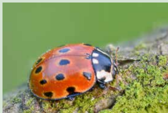
Figuur 9. Zonbeschenen naaldbomen zijn belangrijke biotopen voor enkele bedreigde lieveheersbeestjes in Vlaanderen, zoals het Oogvleklieveheersbeestje (onder), het Achttienstippelig lieveheersbeestje, het Harlekijnlieveheersbeestje en het Bruin lieveheersbeestje.