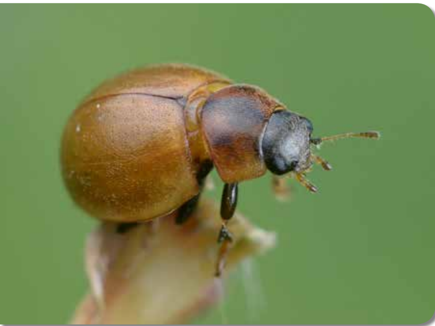
Onbestippeld lieveheersbeestjes.