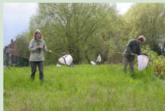
Figuur 2. Nakijken en digitaliseren van museumcollecties (links) en het inventariseren van lieveheersbeestjes met allerlei technieken (zoals hier met sleepnetten) zorgden voor heel wat gegevens over lieveheersbeestjes in Vlaanderen.