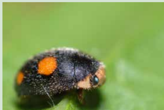
Figuur 8. Een braakliggend, warm ruderaal terrein in de stad kan heel wat bijzondere lieveheersbeestjes herbergen, zoals hier in Evere. In dit soort biotopen vind je warmteminnende soorten als Behaard lieveheersbeestje (rechts), en pioniersoorten zoals Ruigtelieveheersbeestje of Vijfstippelig lieveheersbeestje.

voor overwintering). De keuze van de boomsoorten voor aanplant in een stedelijke omgeving is hierbij cruciaal. Vaak kiezen lokale besturen en groendiensten hierbij voor niet-inheemse bomen die goed presteren met betrekking tot de eigenheid van de stadsomgeving (bodembedichting, luchtkwaliteit, weerstand tegen uitbraken van bladluizen). Deze zijn echter niet altijd gunstig voor lieveheersbeestjes. In borders, wegranden en openbaar groen bieden vaste planten (zoals pollenvormende grassen) een waardevolle microhabitat voor lieveheersbeestjes om te foerageren of te overwinteren. Een extensief beheer, zoals het vermijden van verstoring van de bodembedekking in de winter, biedt onderdak aan lieveheersbeestjes die graag in bladstrooisel, holle stengels of dode takken overwinteren. Het wegmaaïen van jonge stadia (larven, eieren) in bermten moet vermeden worden. Ook in tuinen kunnen deze maatregelen worden toegepast. Een nulgebruik van pesticiden, dat vanaf 2015 de norm wordt voor openbare besturen ( www.zonderisgezonder.be ), zal hopelijk ook particulieren stimuleren minder te gaan sproeien en op langere termijn zorgen voor meer tolerantie voor kruidachtigen in het straatbeeld.