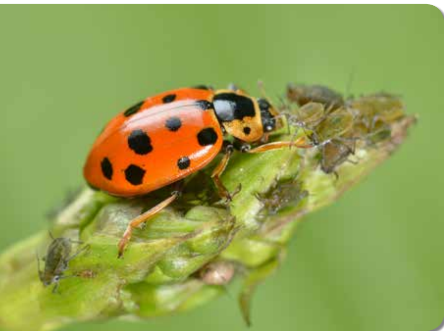
Figuur 10. Dertienstippelig lieveheersbeestje, een soort van wetlands met veel structuur, bladluizen etend op Waterweegbree.

invertebraten toeneemt met de complexiteit van de vegetatie (Usher & Thompson 1993) en dat een heidebeheer gericht op een uniforme paarse heidevegetatie (zoals grootschalig maaien en branden) weinig toegevoegde waarde biedt voor lieveheersbeestjes en andere ongewervelden. Dit geldt met name voor de bedreigde heidespecialisten zoals het Hiëroglielieveheersbeestje en het Zwart lieveheersbeestje. Deze soorten verkiezen structuurrijke heide van verschillende leeftijdsklassen, met opslag van struiken en jonge bomen (San Martin y Gomez & Verté 2004). Voor naaldhoutsoorten zoals het Oogvleklieveheersbeestje Anatis ocellata , het Harlekijnlieveheersbeestje Harmonia quadripunctata en het Bruin lieveheersbeestje Aphidecta oblitterata is het behoud van oude en zonbeschenen naaldbomen van belang, zowel in bossen als in stedelijke omgeving (Figuur 9). Overwinteren doen deze lieveheersbeestjes dan weer achter schors of in dennenappels.