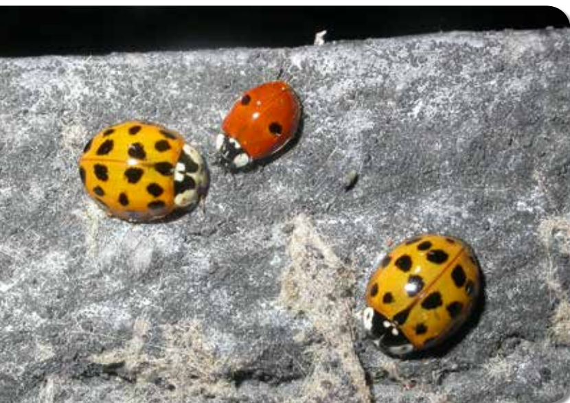
Figuur 5. Het Tweestippelig lieveheersbeestje (midden) is Kwetsbaar door de introductie van het Veelkleurig Aziatisch lieveheersbeestje (links en rechts) in Vlaanderen.