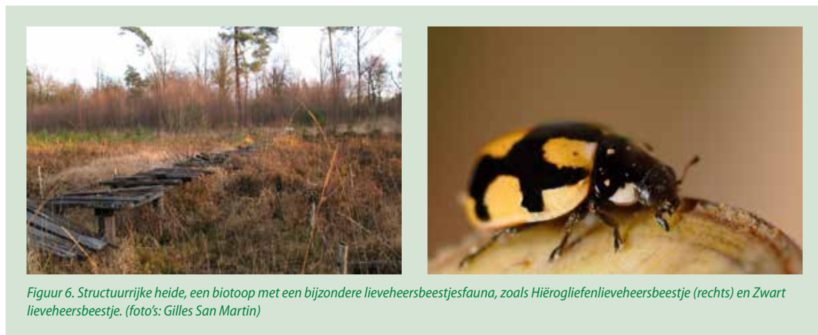
Figuur 6. Structuurrijke heide, een biotoop met een bijzondere lieveheersbeestjesfauna, zoals Hiërogliëfenlieveheersbeestje (rechts) en Zwart lieveheersbeestje.