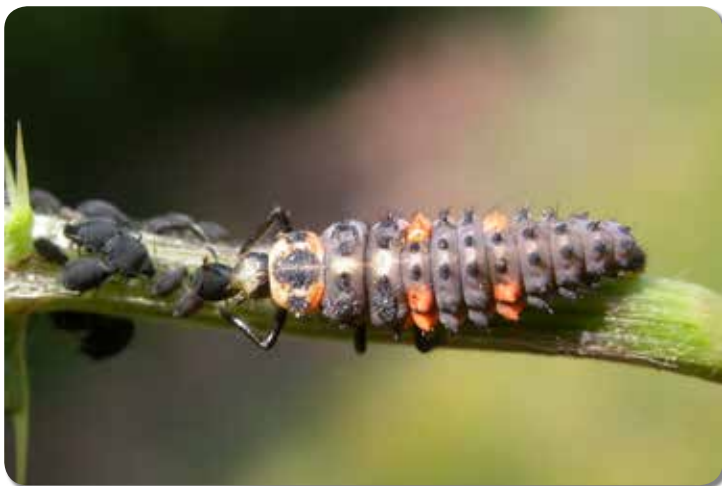
Figuur 1. Een larve van het Zevenstippelig lieveheersbeestje eet een bladluis.

Ondanks al deze kwaliteiten worden lieveheersbeestjes zelden opgenomen in beheerplannen of beleidsdocumenten (Cardoso et al. 2012, Collen & Böhm 2012). Ook in het buitenland is het zoeken naar het gebruik van deze insecten in het beheer en het behoud: alleen Duitsland (Geiser 1998) en Noorwegen (Ødegaard et al. 2010) hebben ooit Rode Lijsten van deze kevergroep opgemaakt, al gebruikten ze daarbij niet de internationaal aanvaarde IUCN-criteria (IUCN 2003). Ondanks het feit dat inheemse lieveheersbeestjes door het Soortenbesluit van 15/05/2009 integraal bescherming genieten (tegen wegvangen), zou een Rode Lijst het gebruik van deze charismatische insecten in het natuurbeheer en -beleid meer dan waarschijnlijk ten goede komen. Met andere woorden: het opvolgen van lieveheersbeestjes kan bijzonder nuttige informatie opleveren over de volledige bladluisetende fauna.