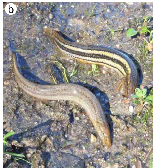
Figuur 4. Afvissingen uitgevoerd in het Limburgs grensgebied aan De Raam, om de effectieve aanwezigheid van Noord-Aziatische modderkruiper Misgurnus bipartitus en Grote modderkruiper M. fossilis in het veld te kunnen vaststellen.