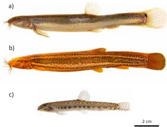
Figuur 1. (a) Noord-Aziatische modderkruiper Misgurnus bipartitus , (b) Grote modderkruiper M. fossilis en (c) Kleine modderkruiper Cobitis taenia .