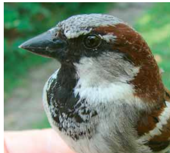
Figuur 12: Adult mannetje Huismus Passer domesticus (met donkere oordekveren) (Foto: Jos Van Kerckhoven) Figure 12: adult male House Sparrow Passer domesticus (with darker ear coverts) (Jos Van Kerckhoven)

Ringmussen lijken en wijfjes meer op Huismussen. De huidige vogel is een wijfje dat toch nogal goed op een Ringmus lijkt. Eigenhuis geeft een aantal verschillen tussen de gefotografeerde vogel uit Aalsmeer en de plaat in Harris et al. (1989). De vogel uit Zichem bevestigt de individuele variatie die er bestaat bij hybriden, vb. in de breedte van de grijze band over de kruin (soms minder duidelijk vooraan of achteraan), de witte tekening boven het masker en aan het oog (van afwezig tot heel duidelijk voor en achter het oog), de sterkte van de tweede vleugelstreep in de grote armdekveren (van afwezig als bij Huismus tot even opvallend als bij Ringmus), de grootte en het contrast van de zwarte oorvlek (van relatief vaag tot heel groot en scherp afgetekend), de rug en stuitkleur (van bruin tot grijsig) en de kleur van de onderzijde (van wit tot vuilwit of zeemkleur). De witte tekening boven het masker en aan het oog is bij mannetjes