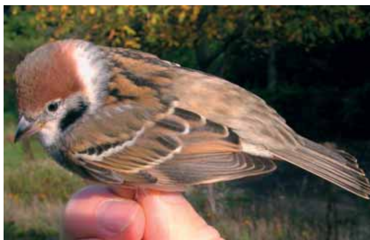
Figuur 1-2. Hybride Ringmus x Huismus Passer montanus x P. domesticus , Zichem 26 okt 2006 (Foto: Marc Herremans) Figures 1-2. Hybrid Tree Sparrow x House Sparrow Passer montanus x P. domesticus , Zichem 26 Oct 2006 (Marc Herremans)