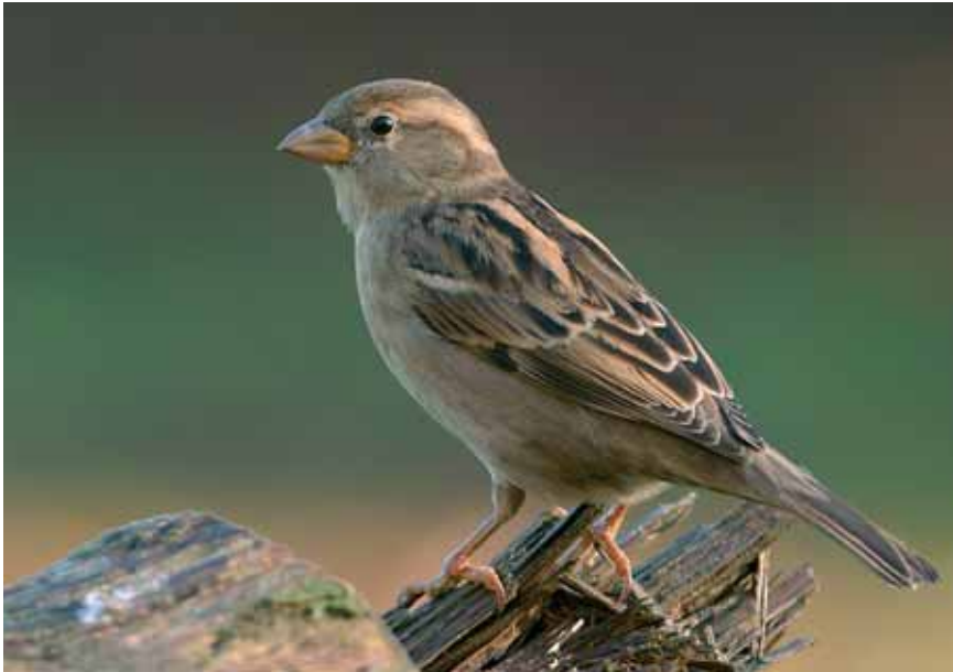
Figuur 13: Adult wijfje Huismus Passer domesticus (Foto: Marc Vermeulen) Figure 13: Adult female House Sparrow Passer domesticus (Marc Vermeulen)

Huisumus trouwens ook erg variabel, van afwezig tot heel opvallend zowel voor als achter het oog, en bovendien zou het voorkomen van relatief meer wit in de loop van de laatste paar decennia sterk toegenomen zijn (van Heurn 2003).