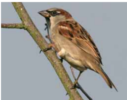
Figuur 9-11: Adult mannetje Huismus Passer domesticus Figures 9-11: Adult male House Sparrow Passer domesticus

kenmerken vertonen van beide ouders en liefst voor de meer uitgesproken verschillen ergens in het midden liggen, maar dat hoeft lang niet altijd zo perfect te zijn.