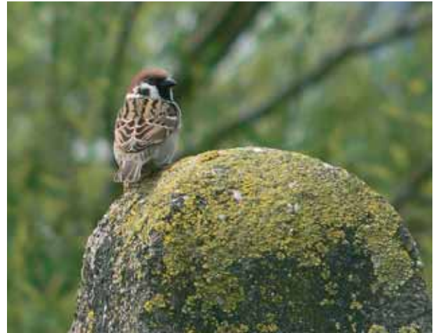
Figuur 7-8: Ringmus Passer montanus Figures 7-8: Tree Sparrow Passer montanus