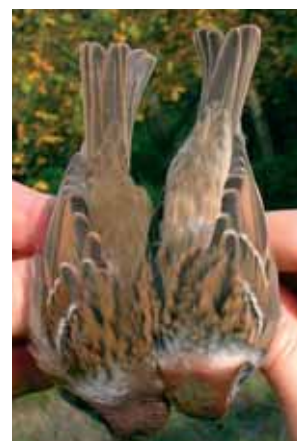
Figuur 3-4. Ringmus Passer montanus (links) en hybride Ringmus x Huismus Passer montanus x P. domesticus (rechts), Zichem 26 okt 2006 Figures 3-4. Tree Sparrow Passer montanus (left) and hybrid Tree Sparrow x House Sparrow Passer montanus x P. domesticus (right), Zichem 26 Oct 2006