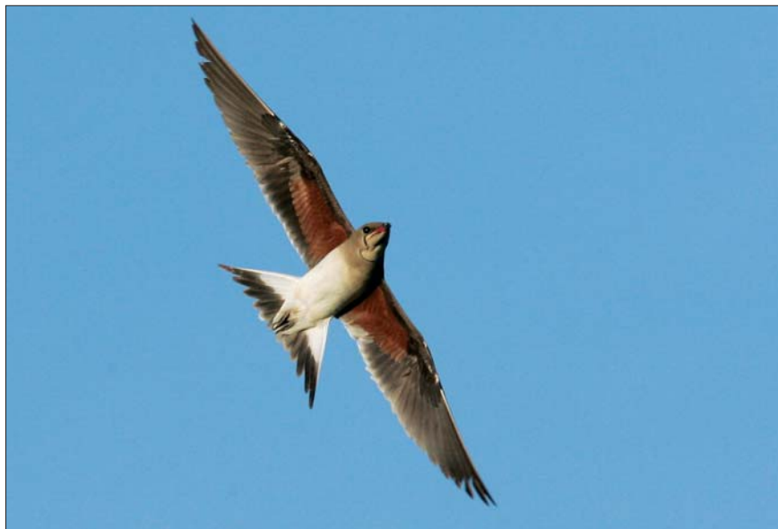
Vorkstaartplevier Glareola pratincola . 23 jun 2008, Oostende (W)

Op 30/31 aug pleisterde een Zeekoet Uria aalge op de Nete te Lier.