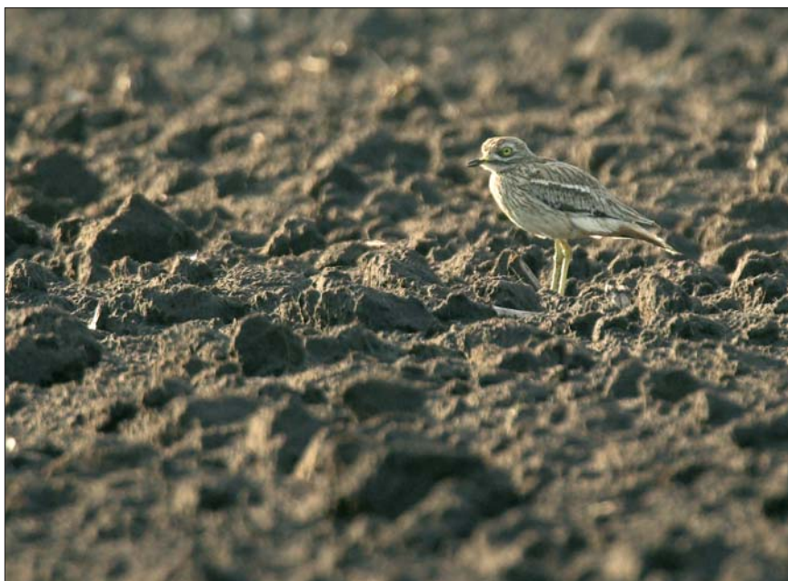
Griel Burhinus oediconemus . 15 jun 2008, Wuustwezel (A)

In de periode juni-juli-augustus werden de hoogste aantallen Zwartkopmeeuwen Larus