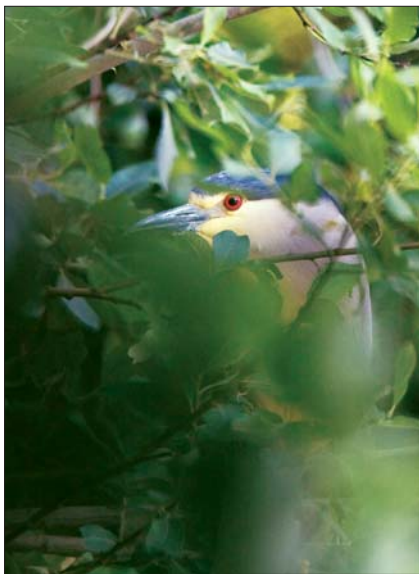
Kwak Nycticorax nycticorax . ad. 17 jun 2008, Geel-Dekshoevijver (A)