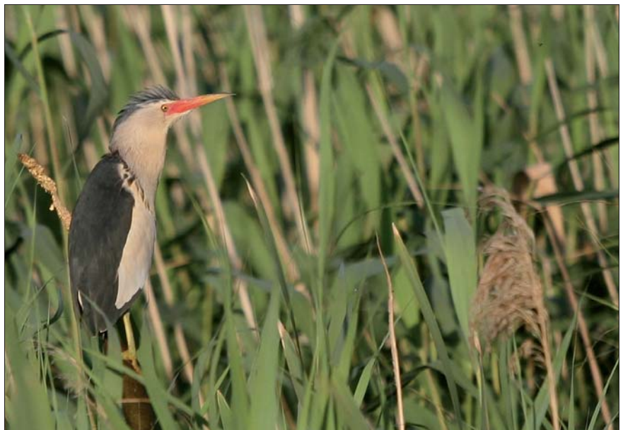
Woudaapje Ixobrychus minutus . ad. ♂. 22 jun 2008, Zeebrugge (W)

Een Kuifaalscholver Phalacrocorax aristotelis werd op 11 aug gezien te Nieuwpoort-IJzermondung.