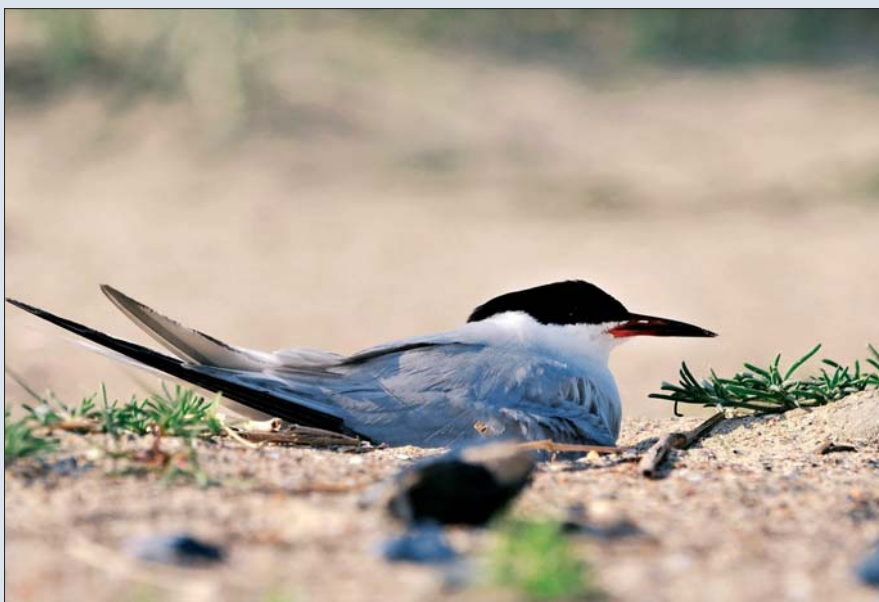
Dougalls Stern x Visdief Sterna dougallii x Sterna hirundo . ad. 10 jun 2008, Zeebrugge-Sterneneiland (W)