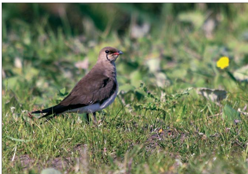
Vorkstaartplevier Glareola pratincola . 22 jun 2008, Oostende (W)