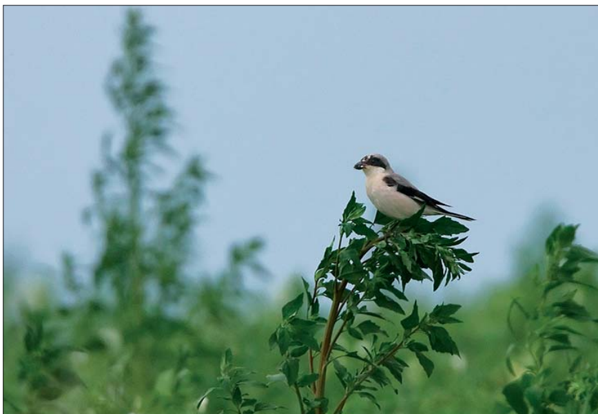
Kleine Klapekster Lanius minor . 20 jul 2008, Opheers (L)