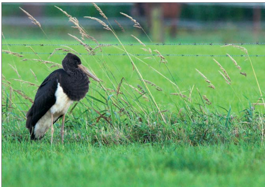
Zwarte Ooievaar Ciconia nigra . juv. 19 jul 2008, Brecht/Overbroek (A)

Van de Lepelaar Platalea leucorodia waren er 19 broedkoppels met 35 uitgevlogen jongen in de Verrebroekse Plassen te Verrebroek. Verder werden aan de Beneden Schelde grotere aantallen genoteerd te Doel-Paardenschor met maximum resp. 23 en 21 ex. op 24 en 27 aug, welke vermoedelijk althans voor een deel betrekking hadden op voormelde broedvogels, Behalve aan de Beneden Schelde waren er ook nog de volgende binnenlandwaarnemingen (met telkens vermelding van het dagmax. indien > 1 ex.): Affligem, Assenede (19), Berlare, Boekhoute, Bornem (3), Destelbergen, Dilsen-Stokkem