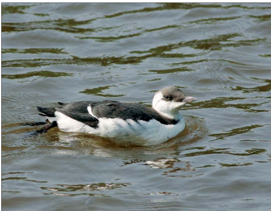
Zeekoet Uria aalge . 30 aug 2008, Lier-Anderstad (A)