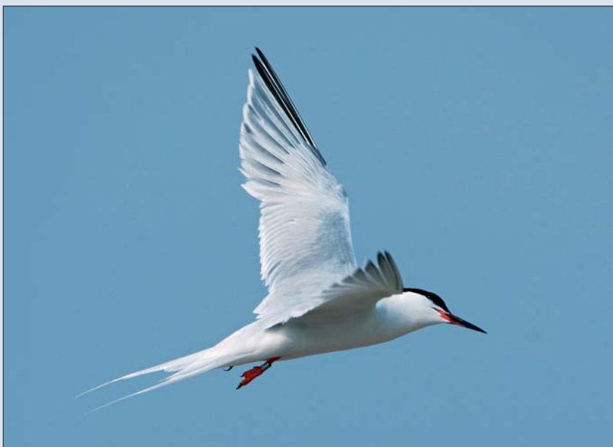
Dougalls Stern Sterna dougallii . ad. 26 jul 2008, Zeebrugge-Sterneneiland (W)