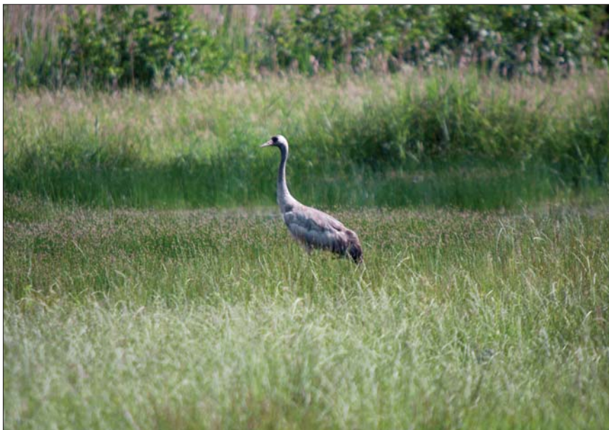
Kraanvogel Grus grus . 2 jun 2008, Balen/Scheps (A)

Berlare, op 30 jun te Kaprijke 1 ad. en op 1 jul te Brecht.