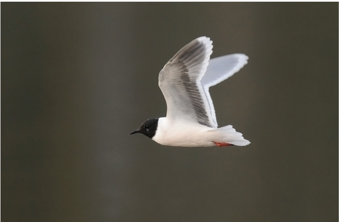
» Dwergmeeuw Hydrocoloeus minutus tweede zomerkleed. 26 april 2010. Bourgoyen, Gent (O)

In 2013 vond in België een broedgeval plaats van de Dwergmeeuw Hydrocoloeus minutus . Na Brilduiker Bucephala clangula in 2009 en 2010 en Grote Zilverreiger Egretta alba in 2012, is dat al de derde nieuwe broedvogelsoort voor België op korte tijd. Opvallend en onverwacht is dat twee van de drie eerder noordelijke dan zuidelijke soorten zijn.