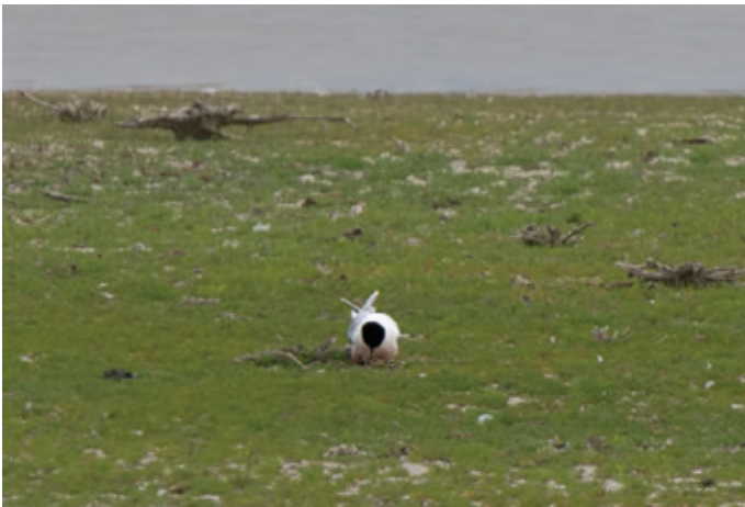
► Dwergmeeuw Hydrocoloeus minutus adult op nest. 12 juni 2013. Doel (O).

Deze bewijsfoto werd genomen vanaf de kijkwand om verstoring te vermijden. Elk spoor afkomstig van een fotograaf die het nest bezoekt kan het voor predatoren zoals Vos Vulpes vulpes gemakkelijker maken om het nest te vinden.