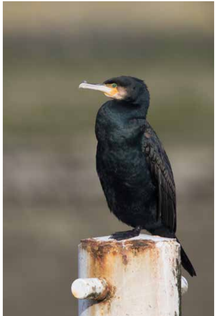
➤ Grote Aalscholver Phalacrocorax c. carbo . 17 januari 2015. Nieuwpoort (W)

Naast de adulte Grote Aalscholver Phalacrocorax c. carbo van Lier, die hier al sinds de winter van 2008-2009 jaarlijks terugkeert, werd deze ondersoort nu ook herkend in Oostende, Zonnebeke en Nieuwpoort. De determinatie is niet altijd even makkelijk en we raden aan om enkel vogels met alle kenmerken als dusdanig te determineren. De opvallendste kenmerken zijn: mannetje Grote Aalscholver is tot ca 1/5de groter dan de ondersoort sinensis , op de ondersnavel loopt de naakte huid vanaf de mondhoek schuin naar voren (65° van horizontaal bij Grote, rechter bij gewone Aalscholver – maar soms moeilijk vast te stellen en er is enige overlap!); de witte keelvlak is meer rechthoekig op de wang en loopt breder uit naar onderen; de glans op de onderdelen is blauw i.p.v. groen; in zomerkleed hebben ze doorgaans minder wit op de zijhals. Grote Aalscholver ruit later naar zomerkleed dan sinensis . Niet alle vogels zijn herkenbaar en individuen die slechts één of enkele kenmerken vertonen kunnen hybriden zijn tussen de twee ondersoorten.