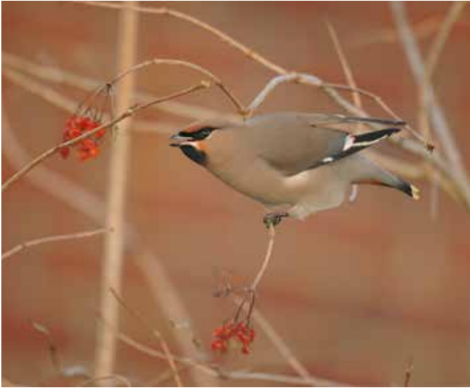
➤ Pestvogel Bombus garrulus . 18 februari 2015. Uitkerke (W)

Klapeksters Lanius excubitor werden enkel waargenomen in de provincies Antwerpen en Limburg, het ging in totaal om ongeveer 25 vogels op evenveel locaties. Op 24 feb werd zowel te Eeklo als te Wetteren een Raaf Corvus corax gezien. De grootste groep Sneeuwgorzen Plectrophenax nivalis was aanwezig te Heist, waar tot 26 ex. werden geteld.