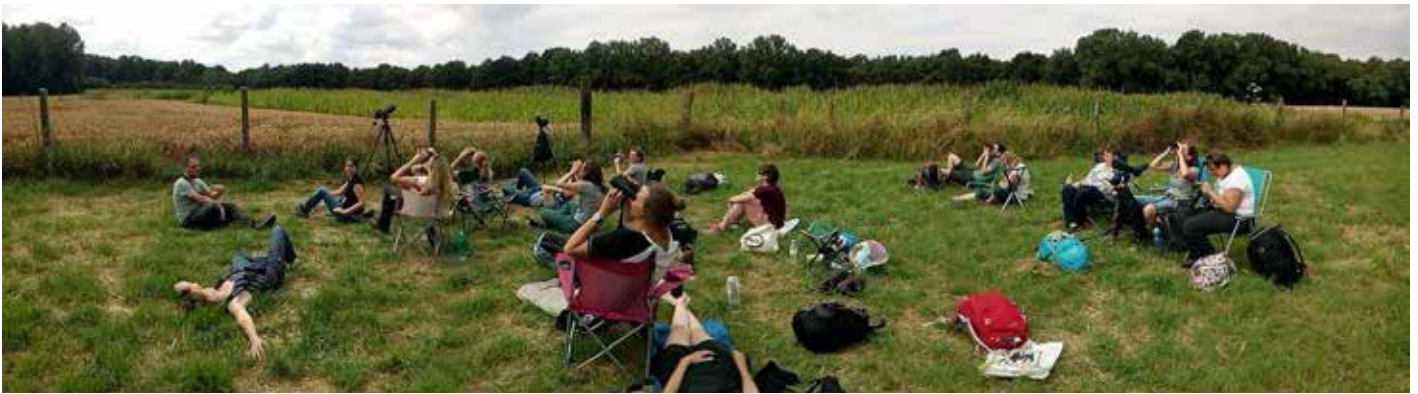
De sociale aspecten en de ontspanning binnen een gezamenlijke hobby blijken bij vrouwen meer doorslaggevend dan bij mannen

wen aanspreekt die anders nooit de stap hadden gezet om vogels te gaan kijken. Dé Duifkes stellen zich vaak de vraag hoe ze verder drempels kunnen verlagen om vrouwen naar buiten te trekken. Zo proberen ze de activiteiten interessant te maken voor zowel beginnende als doorwinterde Duifkes, zijn de uren flexibel en vaak zijn de activiteiten ook kindvriendelijk. Dé Duifkes staan open voor ideeën van hun publiek, de leden bepalen vaak welke activiteiten er worden gepland en hoe avontuurlijk deze mogen zijn.