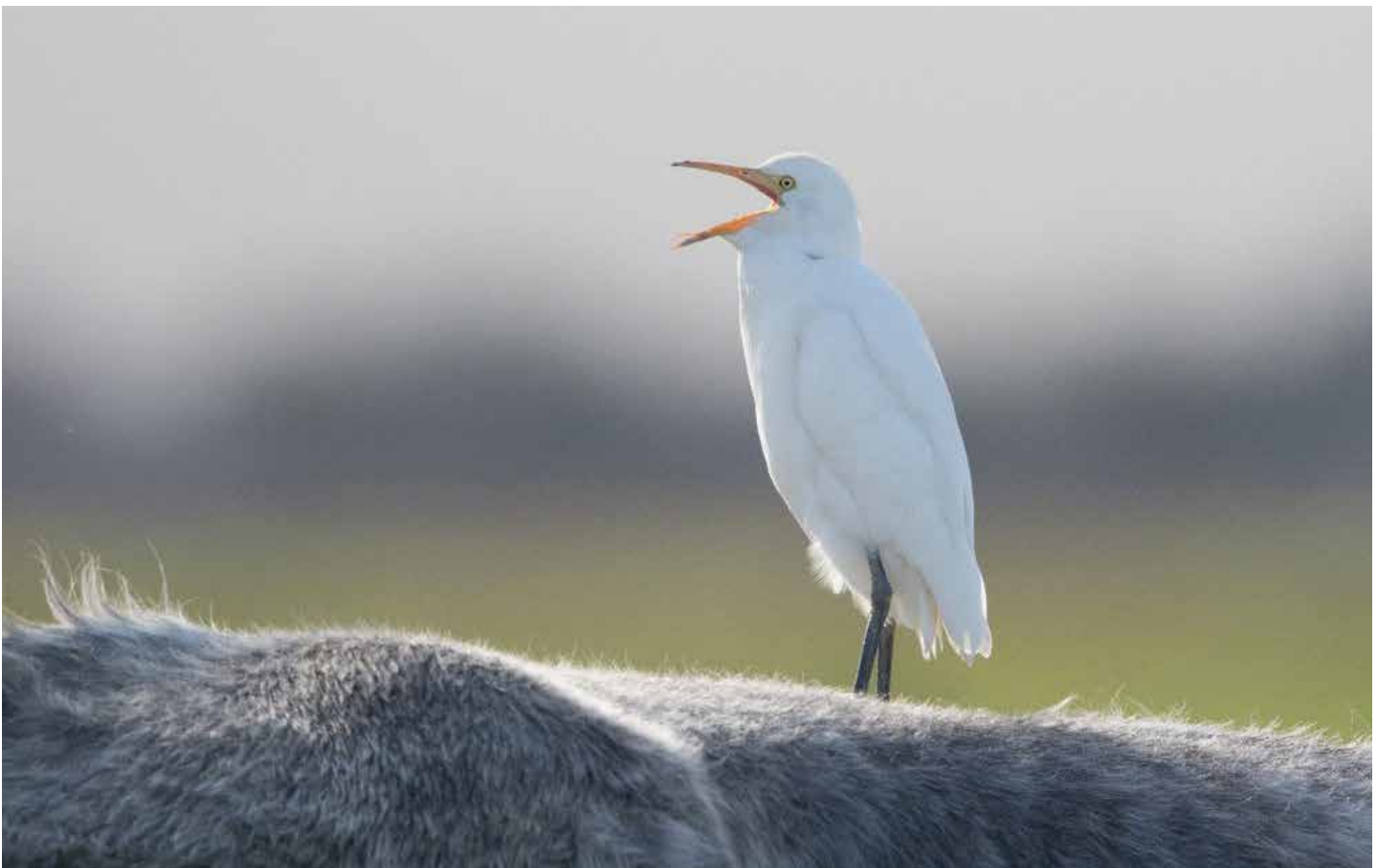
■ Koereiger Bubulcus ibis . 06/11/2019. Uitkerke (W)