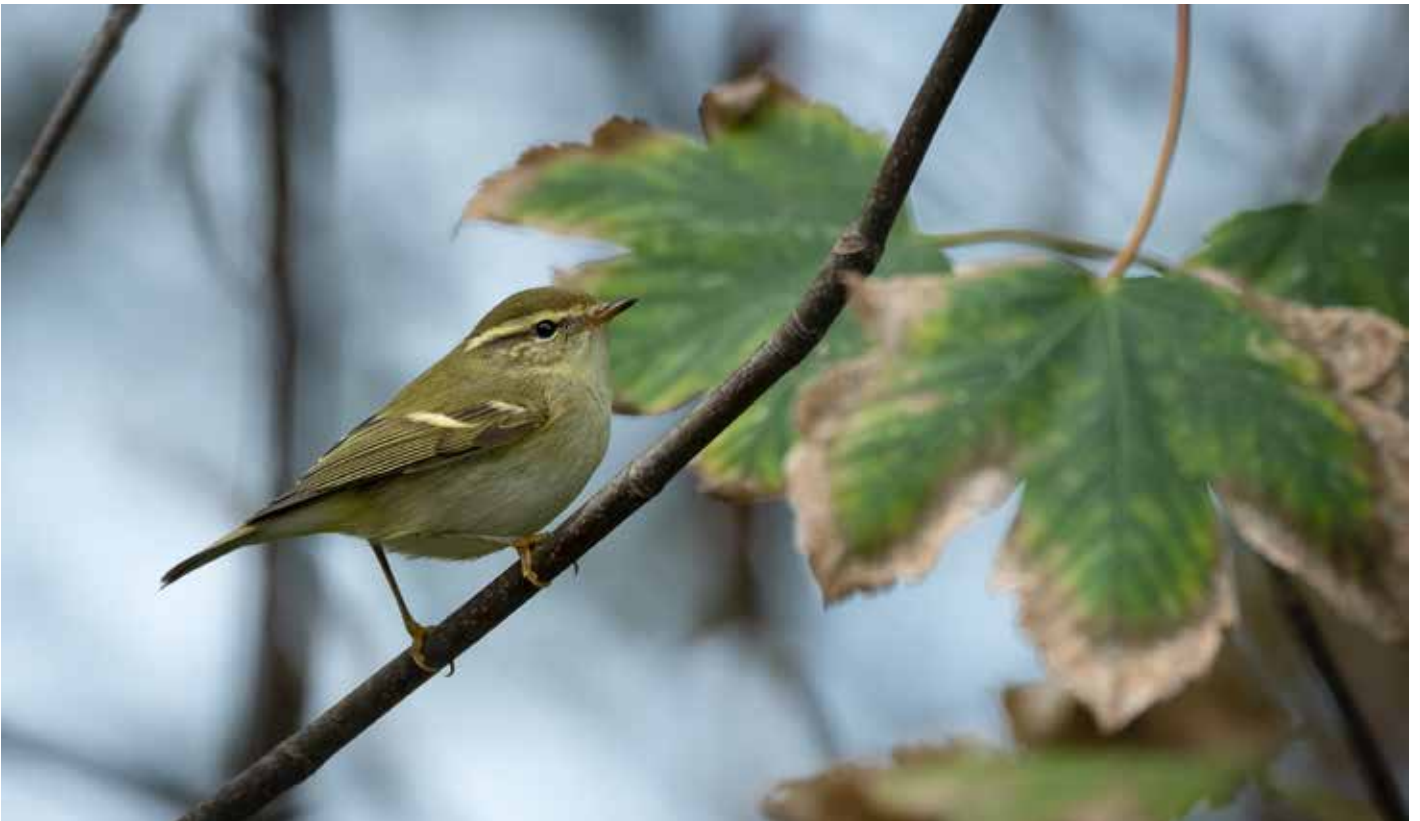
Bladkoning Phylloscopus inornatus . 05/10/2019. Middelkerke (W)

het telkens om solitaire exemplaren. Het hoogste aantal Koereigers Bubulcus ibis dat samen werd waargenomen bedroeg 11 vogels, deze werden op 17/10 in de IJzervallei gezien.