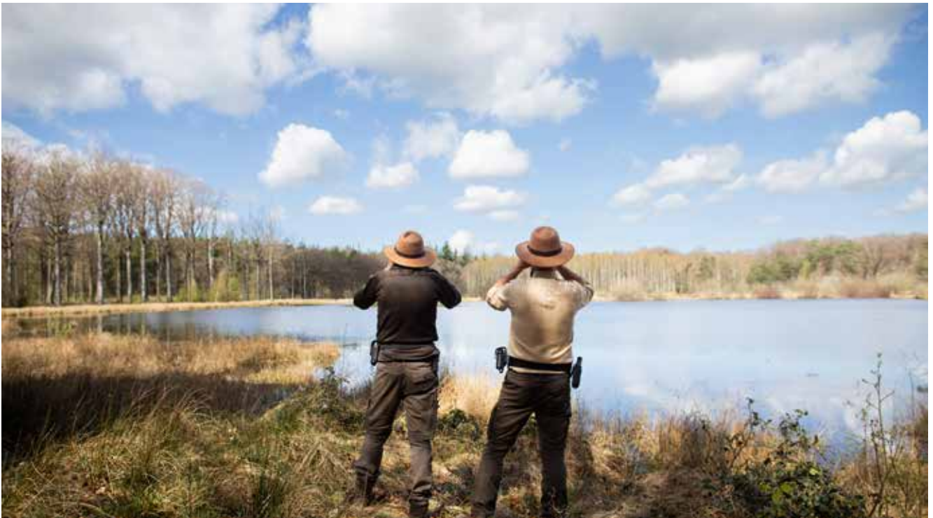
De boswachtershoed is een zeer herkenbaar deel van het boswachtersuniform, maar is niet verplicht.

binnen de Vlaamse overheid is eigenlijk rechttoe rechtaan en volgt een duidelijk uitgestippeld pad: je moet slagen voor het examen van de opleiding Natuurmanagement-basis. Die opleiding volg je bij Inverde, het opleidings- en expertisecentrum van Natuur en Bos. Het examen test zeer grondig de basiskennis van natuur. Wie slaagt voor het examen na het eerste jaar, ontvangt het getuigschrift 'Natuurmanagement (basis)' dat deuren opent en dat bewijst dat hij of zij voldoende inzicht heeft om de eerste professionele stappen te zetten in natuurbeheer bij Natuur en Bos of als vrijwilliger of professional bij o.a. natuurverenigingen. Bovendien is het getuigschrift een belangrijke troef als je wil solliciteren bij natuurorganisaties, gemeenten en provincies. Ook voor de functie van boswachter bij Natuur en Bos heb je het getuigschrift van het eerste jaar Natuurmanagement nodig.