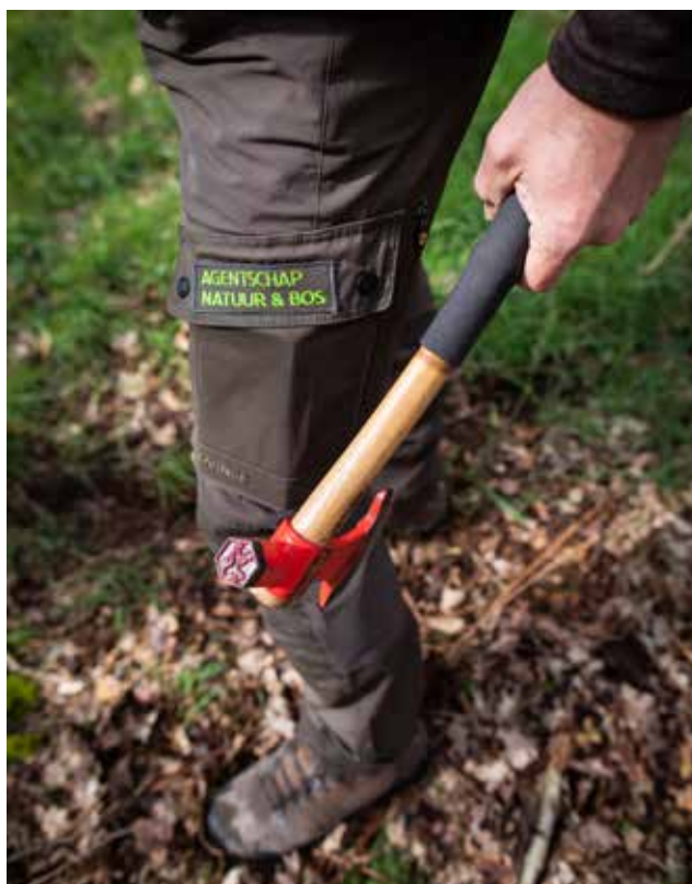
Op de foto bovenaan een meetklem en onderaan de koninklijke hamer waarmee bomen gemarkeerd worden die geveld moeten worden.