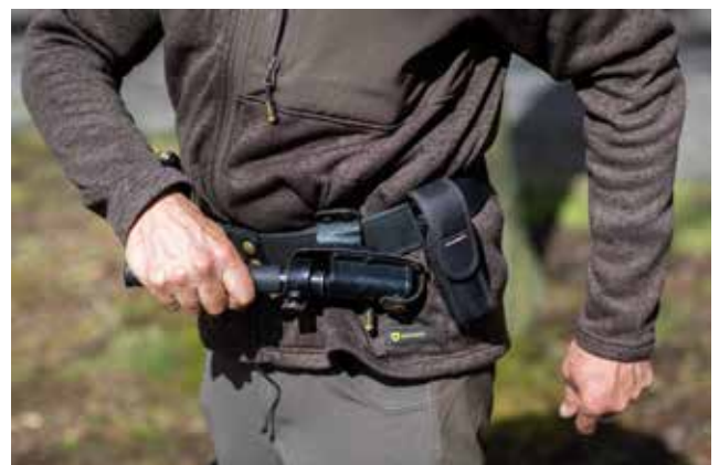
Drie keer per jaar krijgen boswachters een opleiding voor het dragen van pepperspray en de wapenstok.

In tegenstelling tot natuurinspecteurs en bijzondere veldwachters hebben boswachters geen graad van Officier Gerechtelijke Politie (OGP). Boswachters zijn wel aangesteld als gewestelijk toezicht houder bij ministerieel besluit en mogen daarom handhaven en toezicht uitvoeren in de gebieden die ze in beheer hebben. Belangrijk is wel dat de boswachter beëdigd is vooraleer hij of zij aan handhaving kan doen. Daarnaast zijn boswachters bevoegd