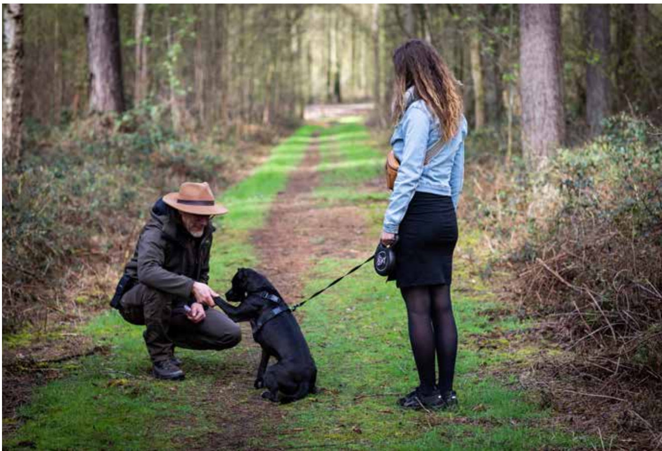
Boswachters doen ook aan handhaving in hun gebieden. Zo houden ze in het oog of honden wel aan de leiband lopen.

Om de natuur in Vlaanderen te beschermen maakte Natuur en Bos het zogenaamde handhavingplan op. Dat plan geeft prioriteit aan de handhaving van onvergunde activiteiten, aan de grootste risico's of aan de inbreuken met de grootste impact op de kwaliteit van onze leefomgeving en natuur. De uitvoering van het handhavingplan is een taak van natuurinspecteurs in dienst van Natuur en Bos, maar ook van boswachters. Omdat