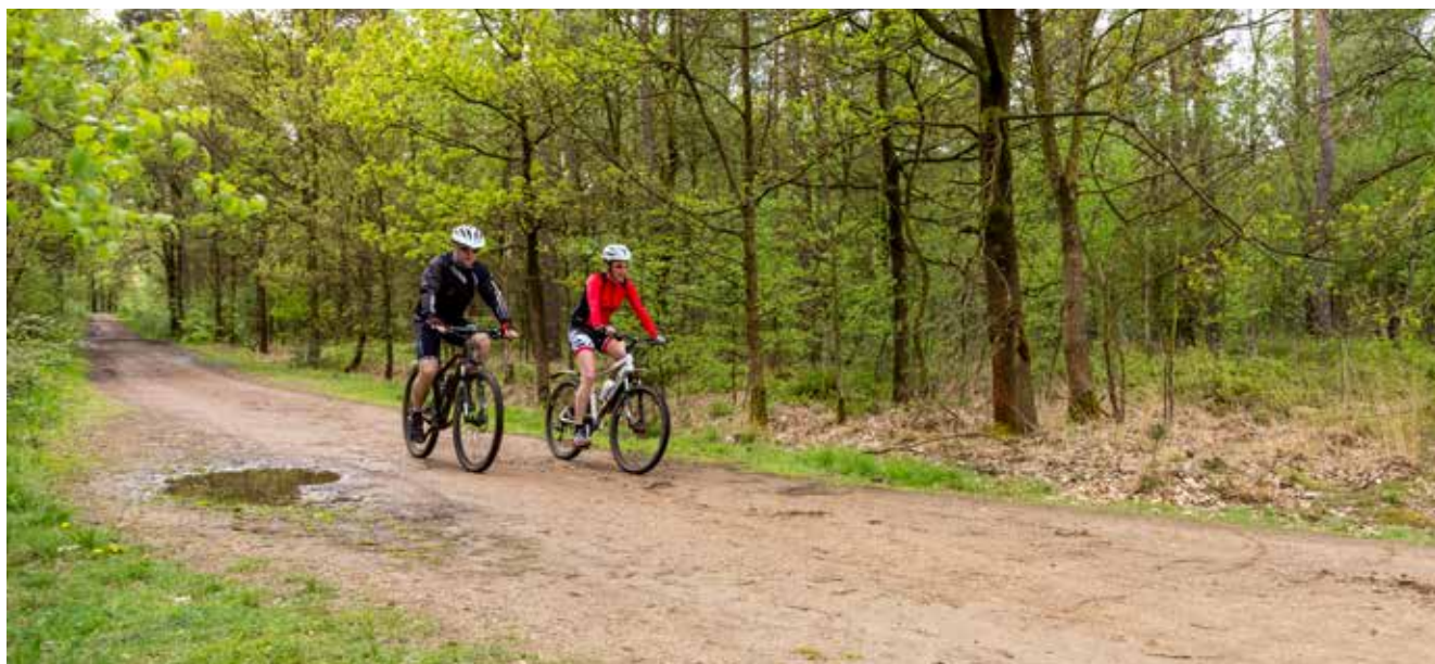
Boswachters zijn verantwoordelijk voor het beheer van hun gebieden, maar ze maken hun domeinen waar mogelijk ook aantrekkelijk voor recreanten, bijvoorbeeld door wandel- en fietsroutes uit te stippelen.

boswachters voor natuurbeheer al veelvuldig aanwezig zijn op het terrein, kunnen zij ook op een efficiënte manier handhaven. Maar waar natuurinspecteurs in hoofdzaak een toezicht-opdracht hebben buiten de domeinen die eigendom zijn van Natuur en Bos, voeren boswachters toezicht uit binnen de domeinen die ze zelf in beheer hebben en die dus veelal eigendom zijn van Natuur en Bos.