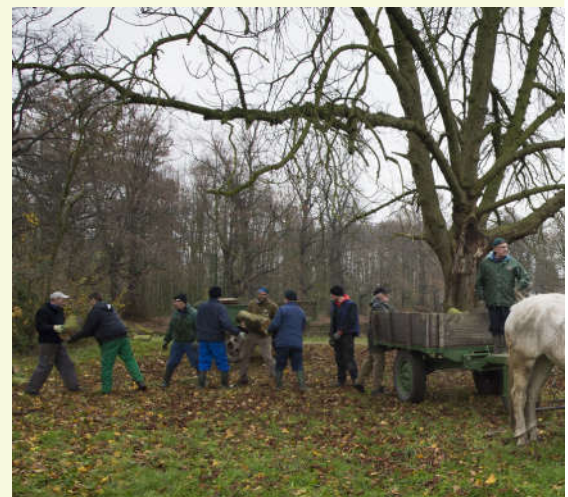
Bosbeheer met paarden

Je stapt verder in de dreef en komt in een van de oudste bosbestanden 8 . Hier werd eeuwenlang een strak hakhoutbeheer toegepast. Om de acht jaar werden de hakhoutstoven gekapt. Het kleinhout werd in 'bossen' of 'facelen' gebonden om de bakoven te stoken. De grachten werden gereinigd, klimplanten verwijderd en alle dood hout opgeruimd. Resultaat was een weelderige voorjaarsflora, bestaande uit slanke sleutelbloem, speenkruid, klaverzuuring, gele dovenetel en bosanemoontjes. Dankzij een degelijk beheerplan wordt dit hakhoutbeheer weer uitgevoerd: een samenwerking tussen de gemeentelijke groendienst en vrijwilligers, die het hout gratis mogen meenemen.