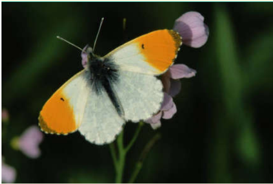
Oranjetipje op pinksterbloem

De enige bemesting is afkomstig van de periodieke overstromingen en de uitwerpselen van de grazers. Tijdens de maand april zien deze hooilanden paarswit van de pinksterbloemen. Ook de echte koekoeksbloem heeft haar plekje teruggevonden en allerlei insecten vinden er een eldorado. Het oranjetipje, een prachtig vlindertje dat zijn eitjes aflegt op pinksterbloem of look zonder look, zal je hier in het voorjaar heel talrijk aantreffen.