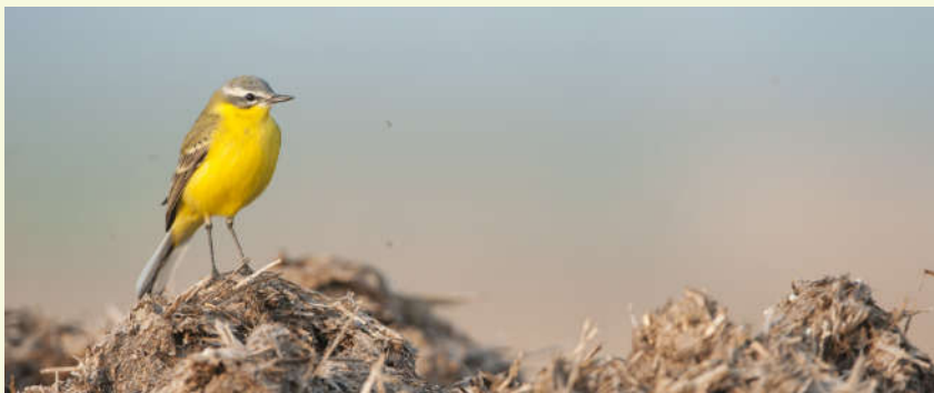
Grote gele kwik

Nu kom je opnieuw in de verbindingdreef. Je stapt naar links. Je komt langs twee majestueuze eiken, overlevenden uit het oorspronkelijke park, aangelegd in de 18de eeuw. Je kruist opnieuw de Poekebeek 15 . Hier heb je kans om een ijsvogeltje of de grote gele kwik te zien. Die laatste is een regelmatige broedvogel in het park.