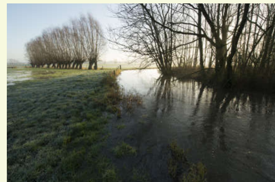
Poekebeek buiten oevers

Bij hevige regenval treedt de Poekebeek heel snel buiten haar oevers. Vooral tijdens de winter hoor je er dan het typische geluid van de wintertaling, een eendensoort. Vroeger bleef dit water tijdens de winter heel lang op de meersen staan. In Poeke schatte men in 1941 de periodiek overstromde oppervlakte op 27 hectare. Aan de linkerkant kocht Natuurpunt Aalter een grasland 10 aan. Er werd een drinkpoel gegraven, een houtwal aangeplant en langs de beek verschenen opnieuw populieren. In samenwerking met een lokale landbouwer werd ook hier een hooiweidebeheer opgestart. Ook de beekdalbosjes voor je werden aangekocht. Hier werd geopteerd om een nulbeheer uit te voeren. De bosjes vormen een schuilplaats voor de vos, reeën en kleine zoogdieren. Tijdens de lente hoor je er de bosrietzanger, zwartkop en tuinfluiter. Hopelijk voelt de nachtegaal zich ooit aangetrokken om hier opnieuw te broeden. Wielewaal, fluiter en nachtegaal waren trouwens tot in de jaren '90 van vorige eeuw regelmatige broedvogels in het park.