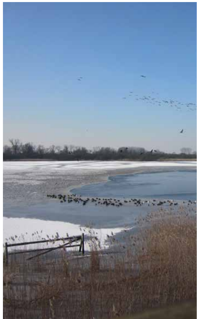
^^ Grote zilverreiger ^ Winterzicht