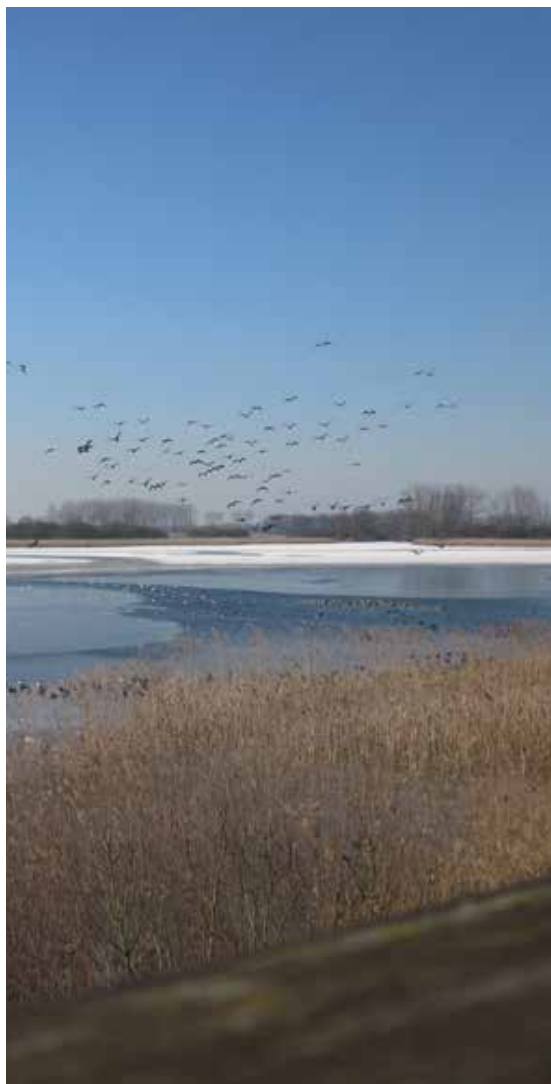
Eenden en ganzen op de Blankaartvijver