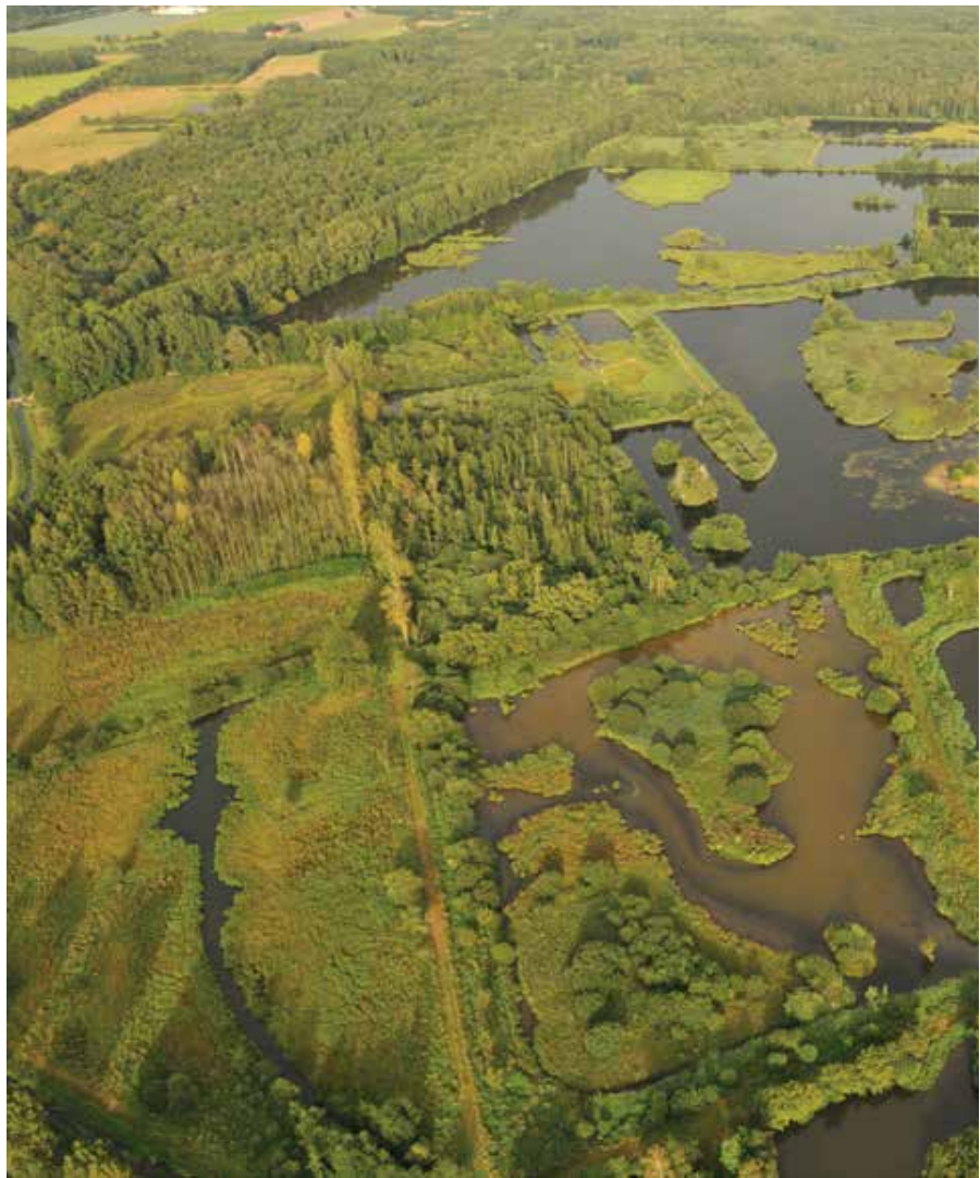
De natuur kreeg in De Luysen alle kansen en greep die met beide handen.