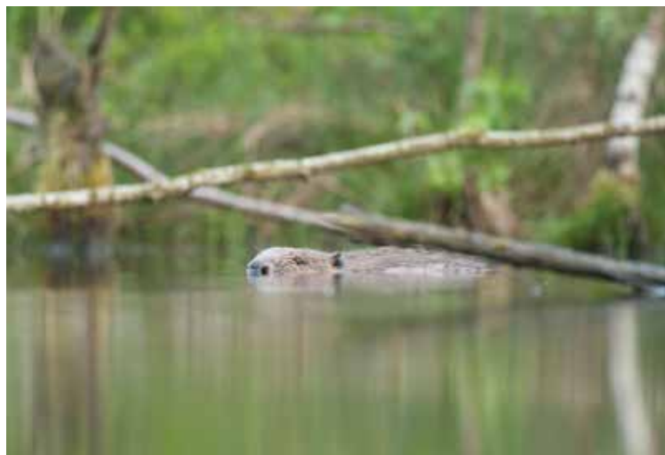
Boven: Hier leeft de enige vrije populatie edelherten in Vlaanderen. Onder: Bevers kunnen hier meebouwen aan wildernisnatuur.

“Van oudsher heeft Sint-Maartensheide veel kleinschalige landschapselementen: houtkanten, struwelen en poelen”, zegt Leo. “Die hebben we beschermd en we legden nieuwe aan. Beheren doen we samen met landbouwers.” Het resultaat? Een gevarieerd landschap, met onverwachte gasten. De grauwe klauwier bijvoorbeeld, een vogeltje met een haakbek en een zwart masker. Hij vangt kevers, sprinkhanen, libellen en muizen. Die spiest hij soms op doornstruiken. Voor de Vlaamse populatie is het gebied zo belangrijk dat de gemeente Bree de soort heeft geadopteerd. “En als je geluk hebt, kan je boomkijkers horen kwaken”, zegt Leo. “Die zijn met honderden teruggekeerd nu we geschikte poelen hebben gegraven.”