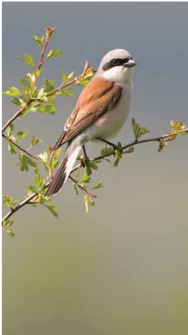
De grauwe klauwier herken je aan zijn haakbek en zwarte masker.