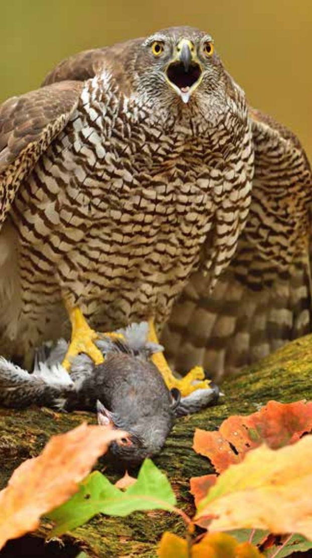
Sinds een paar jaar broedt hier de havik.