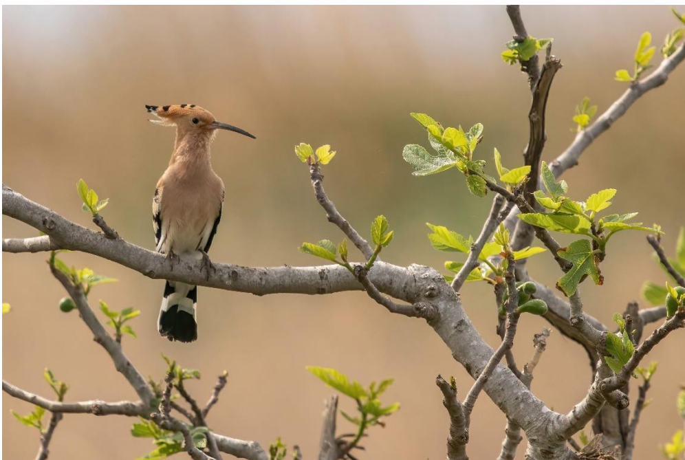
Hop in Akrotiri

Dipper: Cyprusdwergooruil vaak gehoord maar niet gezien. Veel minder orchideeën dan verwacht/gehoopt. Packed lunches: no, thank you.