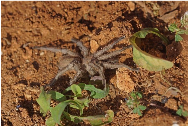
Vogelspin of tarantula

verstopt zitten. Vraag mij niet welke soort – dat is specialistenwerk – maar er zijn er twee op Cyprus. Ook Schreibers franjeteen zit mooi te poseren. Dat is geen spin, maar een hagedis by the way.