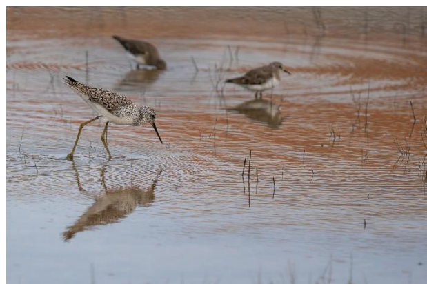
Poelsnip met op de achtergrond 2 Temmincks strandlopers