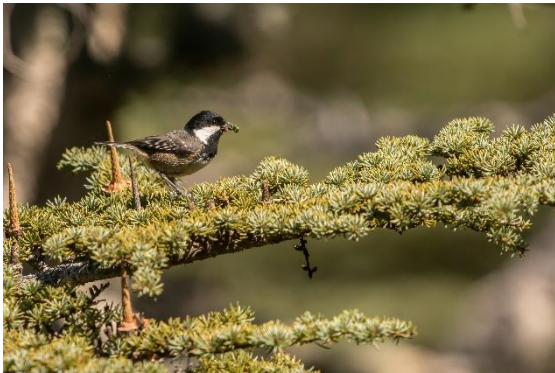
Zwarte mees cypriones op Cyprusceder