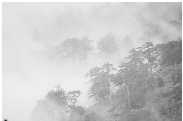
Troödos in de mist