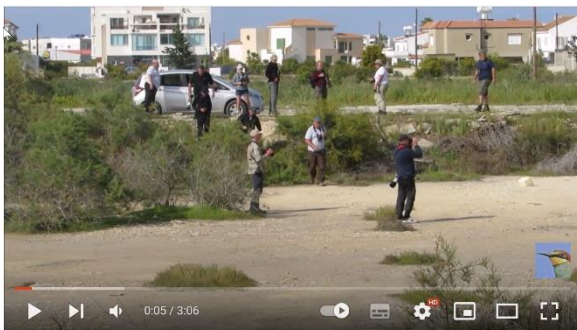
British birdwatchers looking for a very rare Diederik Cuckoo at Paralimni Lake

Ook tijdens de picknick laten we geen tijd verloren gaan. Aziatische steenpatrijs en Maskerklauwier laten zich goed zien, en op een pas gemaaid stuk hooiland zitten verschillende tapuiten. Gewone, maar ook Oostelijke blonde. Ook een Roodkopklauwier werkt goed mee. Een soort die we bijna dagelijks te zien zullen krijgen, maar waar je nooit genoeg van krijgt. Zo mooi is ze.