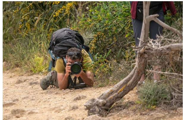
Giorgios in actie

Ook tijdens de picknick laten we geen tijd verloren gaan. Aziatische steenpatrijs en Maskerklauwier laten zich goed zien, en op een pas gemaaid stuk hooiland zitten verschillende tapuiten. Gewone, maar ook Oostelijke blonde. Ook een Roodkopklauwier werkt goed mee. Een soort die we bijna dagelijks te zien zullen krijgen, maar waar je nooit genoeg van krijgt. Zo mooi is ze.