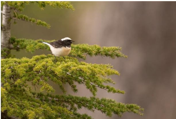
Cyprustapuit op Cyprusceder