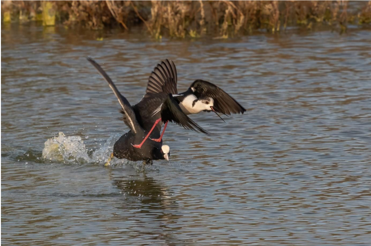
Steltkluut weggejaagd door Meerkoet

Wie vroeg genoeg uit bed kon had al de gelegenheid om wat watervogels te kijken, want ons hotel ligt op een boogscheut van de zuidelijke schuilhut van de Oroklini moerassen. Witoogend, Krooneend, Flamingo, Dodaars en Steltkluut zijn de beloning.