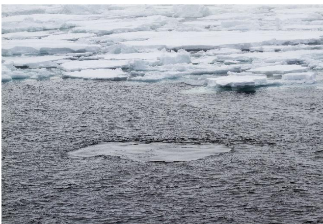
Footprint van Groenlandse Walvis

Een uurtje later: sensatie bij de enkelingen die op het dek de mist trotseerden en niet de lezing in de lounge bijwoonden: er kwam een nu zeer duidelijke Groenlandse walvis vlak voor de boeg voorbij zwemmen! Hola, wat is dat hier? Opnieuw drie kwartier wachten, opnieuw geen spoor meer van het dier. Potverdorie toch. De frustratie bij sommigen die ook de IJsbeer hadden gemist liep enigszins op, maar van agressie was gelukkig geen sprake ;-).