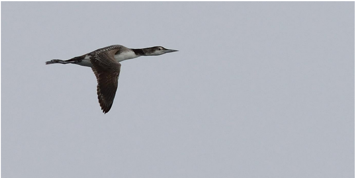
Immature IJsdruiker

Eindelijk werken de walvisachtigen goed mee. Al die uren wachten en die 'mogelijke vinnen' worden omgezet in goede waarnemingen van groepjes Butskoppen, sommige vlakbij en goed te zien! Het lijken afgezaagde boomstammen met een flinke rugvin. Soms is de lange bek ook even te zien, maar de forse lichte voorhoofden zijn toch het opvallendste. In totaal hadden we er minstens 14. Ook erg leuk is de Gewone vinvis die we een tijdje van dichtbij konden volgen. Eindelijk werken ze mee. Iedereen is nu overtuigd: walvissen bestaan!