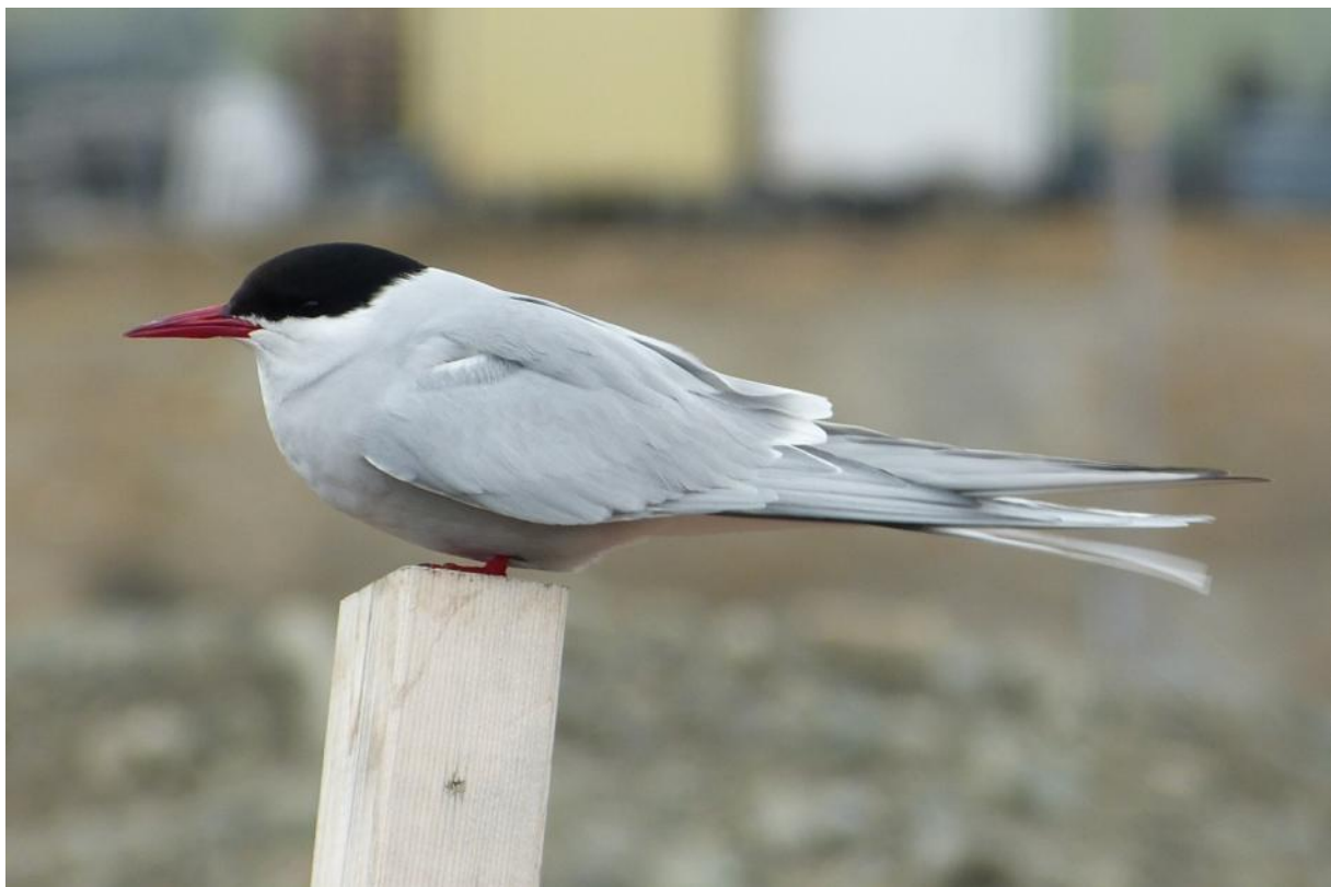
Noordse Sterns maken zich klaar voor het broedseizoen

Slapen? Niet voor lang... Er was een extra vroeg ontbijt en dan begon de ontschepping met zodiacs, want inmiddels lagen we niet meer aan de (dure) kade. Al snel zat iedereen op een bus of taxi en spatte de intussen hechte groep uiteen. Sommigen vlogen direct huiswaarts, anderen bleven hier nog één dag tot zelfs een week. Pieter van Inezia had twee busjes geregeld die rondjes reden in en rond de stad: een prima systeem om alle vogelgebieden te leren kennen op korte tijd. Of om aan de sneeuwregen te ontsnappen op zoek naar een warme chocomelk, want de zon was vandaag niet meer te zien, bij een koele 3°C. De Arctische lente was nog maar pas komen piepen... Brrrr.