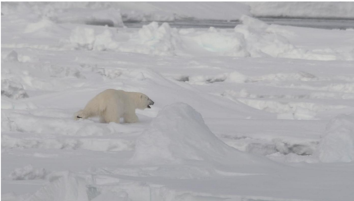
De eerste, gekwetste Ijsbeer

Plots was het dan zover, veel sneller dan verwacht: "IJSBEER!", weerklonk tegelijkertijd op verschillende locaties aan boord op gedempte toon. De boodschap verspreidde zich razendsnel over de verschillende dekken en al snel fluisterde iedereen. Rupert had er immers op gedrukt dat het muisstil moest zijn om het dier geen angst aan te jagen. Op een 500 meter afstand aan bakboord liep inderdaad een pracht van een Ijsbeer. Hij bleef even staan om te kijken en te ruiken en ging er dan snel vandoor. Jammer genoeg bleek hij een gebroken of gekwetste voorpoot te hebben en mankte behoorlijk. In zo'n bikkelharde omgeving wordt dat moeilijk overleven. Wellicht mede door zijn handicap voelde hij zich niet echt op zijn gemak en verdween al gauw achter de ijsschotsen. Al werd het bericht onmiddellijk na de vondst omgeroepen in de buik van het schip, een 15-tal slapenden raakten niet op tijd aan dek. Compassie, medelijden en ocharmes werden hun deel. En de gedrevenheid om er nóg één te zoeken werd alleen maar groter!