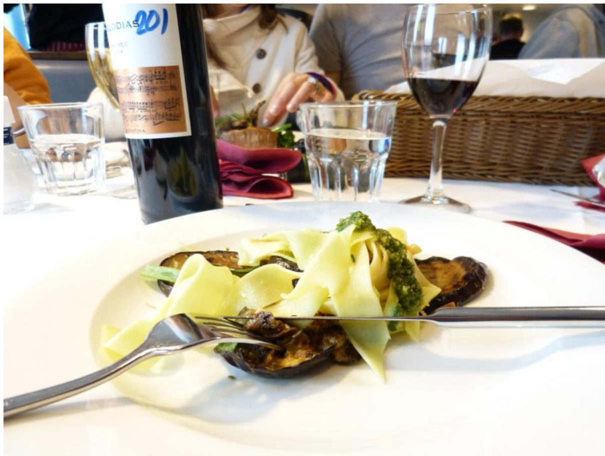
Het eten aan boord was prima

Natuurlijk wordt het weer te laat om goed te zijn. Het is ook de laatste avond op zee. Dan kan er al eens een extra glas wijn af.