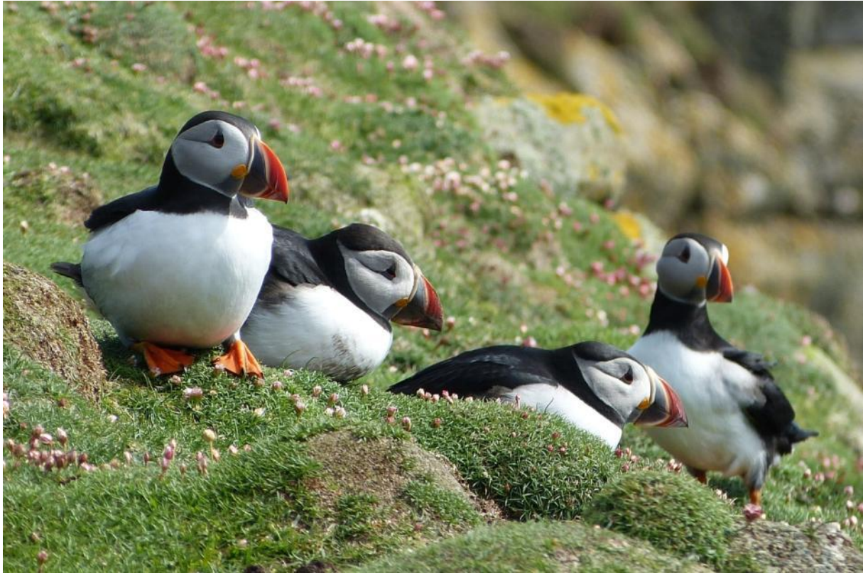
Papegaaiduikers lieten zich ultiem mooi bekijken

gestrande trekvogels als Grauwe klauwier, Bonte vliegenvanger, Kruisbek, Velduil, Houtsnip en voorwaar een Grauwe fitis op een weideafsluiting! Anderen bleven plakken in het theehuis of, meer nog, op het einde van de wandeling bij de papegaaiduikerkolonie! Tientallen schattige knuffels keken naar ons en wij naar hen. Schuw zijn ze helemaal niet en menig plaatje werd geschoten. Op de achtergrond dreef de Plancius op de blauwe zee, om het zicht helemaal af te maken. Een klein regenbuitje was nodig om iedereen weg te krijgen, terug richting zodiac. Achteraf hoorden we dat de Engelsen bijzonder opgetogen waren over het goede gedrag van die hele bende volk (1,5 keer de lokale populatie...). Vaak krijgen ze toeristen die overal door lopen en rondneuzen, maar de Natuurpunteren waren een fijn publiek!