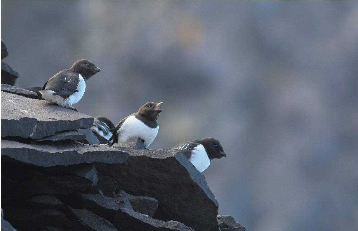
Kleine Alkjes in de kolonie

De wandeling eindigde aan een keienstrand met veel wrakhout met daartussen gigantische kaakbeenderen en wervels van een Groenlandse walvis. Een restant van de hier ooit florerende walvisvaart. Een bezoek aan het lokale toiletgebouwtje was ons sterk aangeraden door de crew. Speciaal! Enkele oude graven van Nederlandse walvisvaarders herinnerden aan een veel harder verblijf hier.