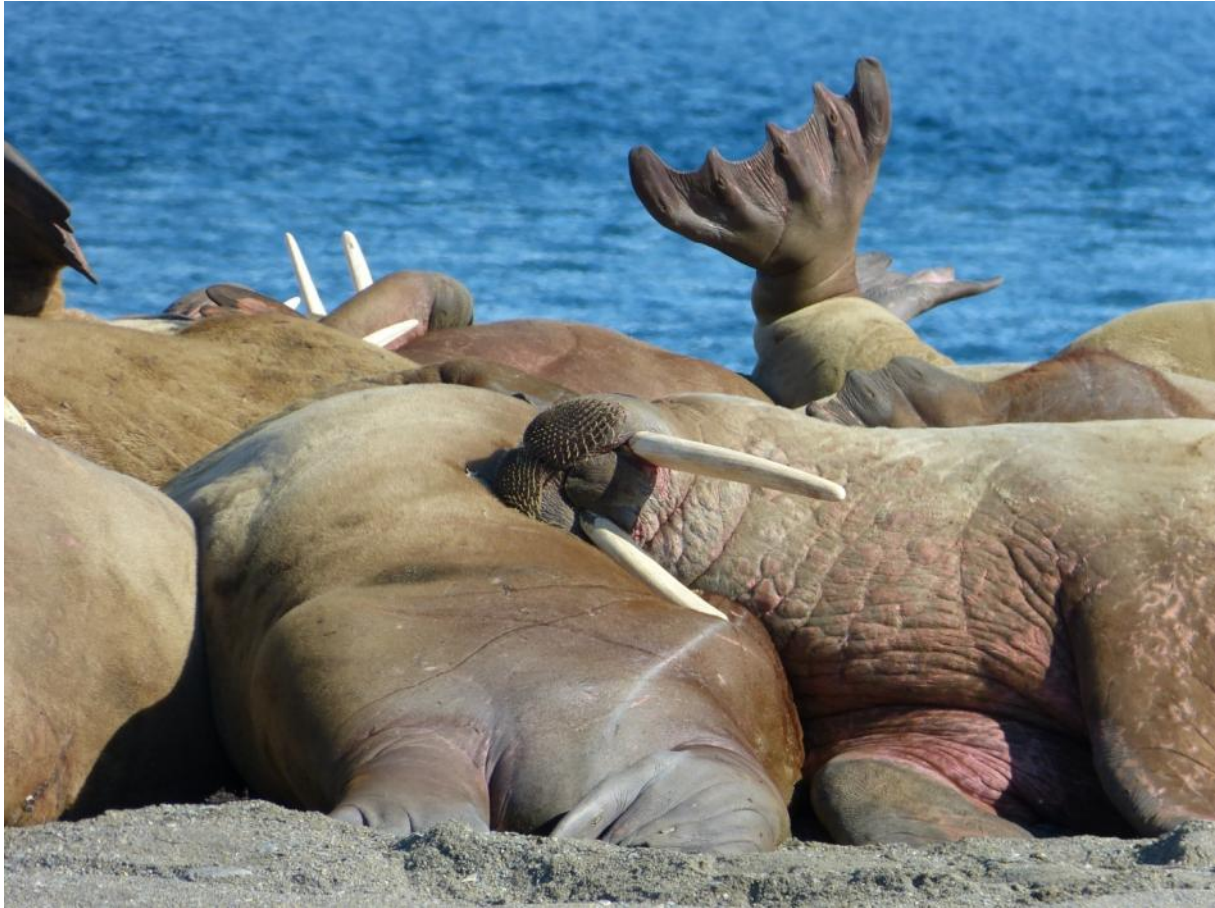
De Walrussen genieten intens van de zon en de warmte