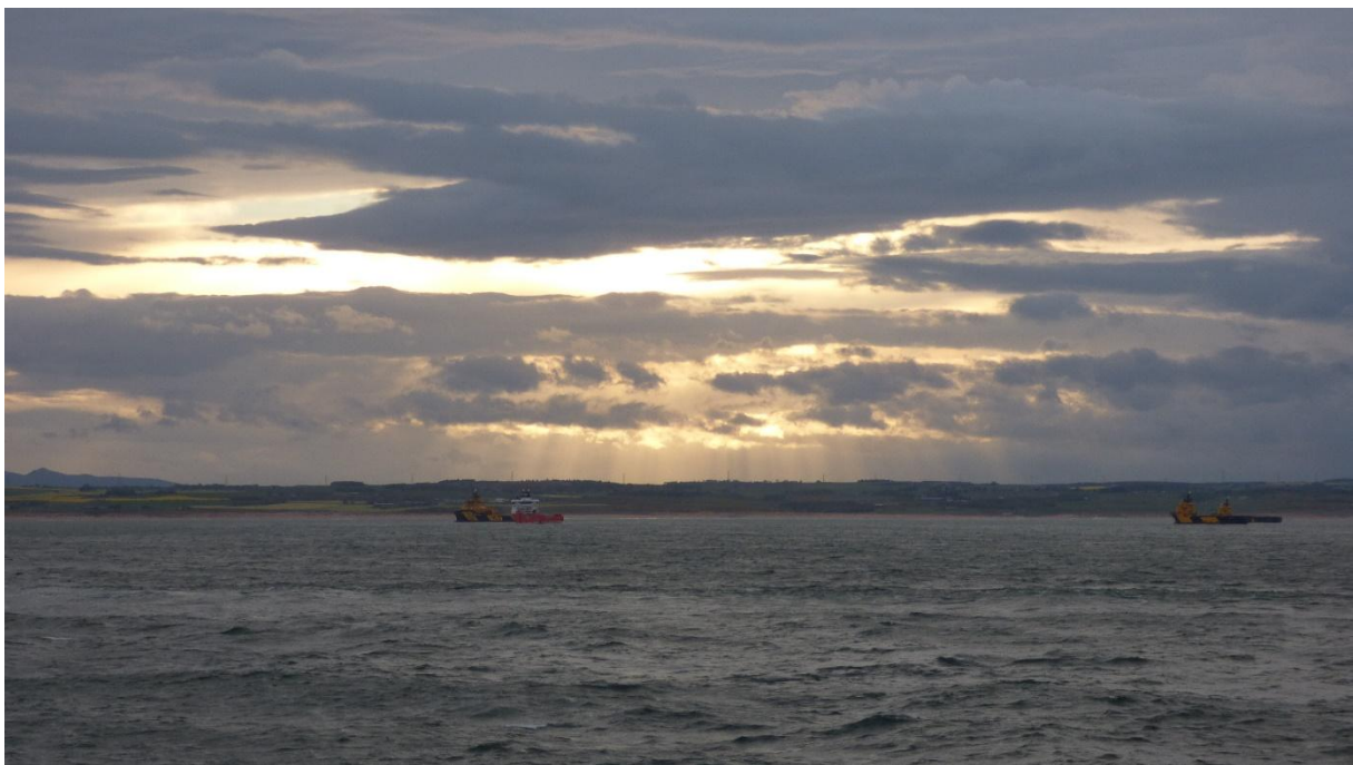
Zonsondergang bij Aberdeen

De rederij had het goed kunnen regelen met de havenautoriteiten zodat we weinig tijd verloren. Binnenvaren, ambulance staat klaar, patiënt overbrengen en terug wegwezen. Aberdeen is gekend als de grijze stad, door al die grijze natuursteen en de grijze luchten... In de haven lagen vooral bevoorradingsschepen voor boorplatforms, maar gelukkig ook Eidereenden en Grote zaagbekken. Dé show werd echter gestolen door een achttal Tuimelaars dat ons bij het binnen- en het buitenvaren uitgeleide deed!