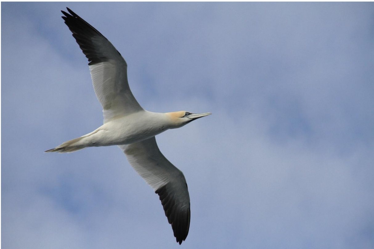
Adulte Jan van gent

De voordrachten werden alweer druk bijgewoond en was er tijd voor de resultaten van de quiz. De winnaars waren de ploeg "Saam", gevolgd door "De Grootste Jagers" en de ploeg van Inezia "Jan Piet Joris & Corneel". Ze konden kiezen uit een mooie set prijzen!