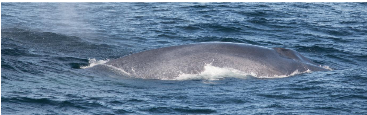
Blauwe Vinvis

Na drie kwartier houden we het voor bekeken. De Blauwe vinvis liet haar kop en eindeloze rug vele keren prachtig zien en leek hoegenaamd niet verstoord door onze aanwezigheid. Iedereen gaat weer slapen. Ik blijf nog een beetje treuzelen in dat mooie licht. En net als ik wil vertrekken is er een andere wakkere die opnieuw een blow opmerkt. Een kleinere dit keer. Een Bultrug! Het slapen wordt weer uitgesteld. Het schip zal niet naderbij varen maar wat vertragen. We zien het dier een aantal keer ademen en twee keer zien we de gekende staart naar boven komen. Schitterend! Maar dan is het genoeg, ik moet en zal nog wat slapen. Er dobbert nog snel een eerste Walrus voorbij, maar die is voor maar een enkeling weggelegd.