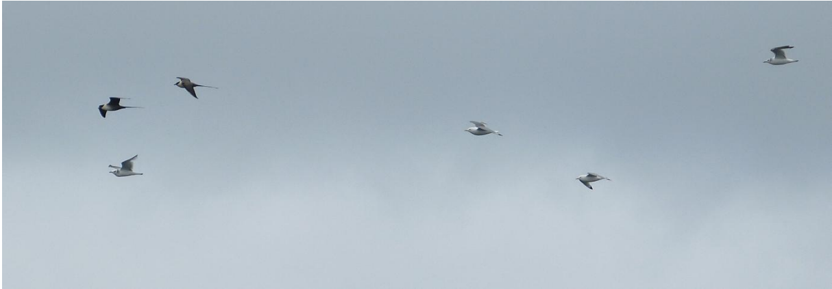
Twee Kleinste jagers met Drieteenmeeuwen in hun kielzog

Voor de walvisspotters was het weer keihard werken geblazen want de zee wilde nog niet kalm worden. Toch kwamen geregeld Witsnuitdolfijnen ons vermaken, eenmaal zelfs een groepje van 10 stuks. Eén dier kon je vanuit de lounge goed zien terwijl het naast het schip zwom. Wat zijn dit prachtige dieren!