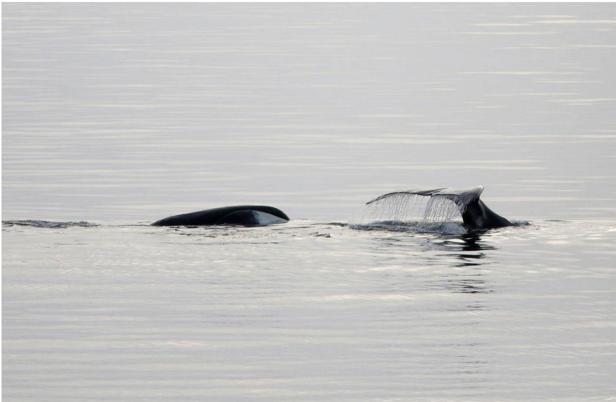
Groenlandse Walvis: twee uit de zeer lange reeks

Om 02u was het nog niet helemaal gedaan met de walvissen, maar ik besloot om toch de bedstee op te zoeken voor minstens een uur of vijf. Er was een ploegensysteem opgezet met vrijwilligers om dag en nacht verder naar IJsberen te speuren, ze zouden ons wel wakker maken als het zover kwam.