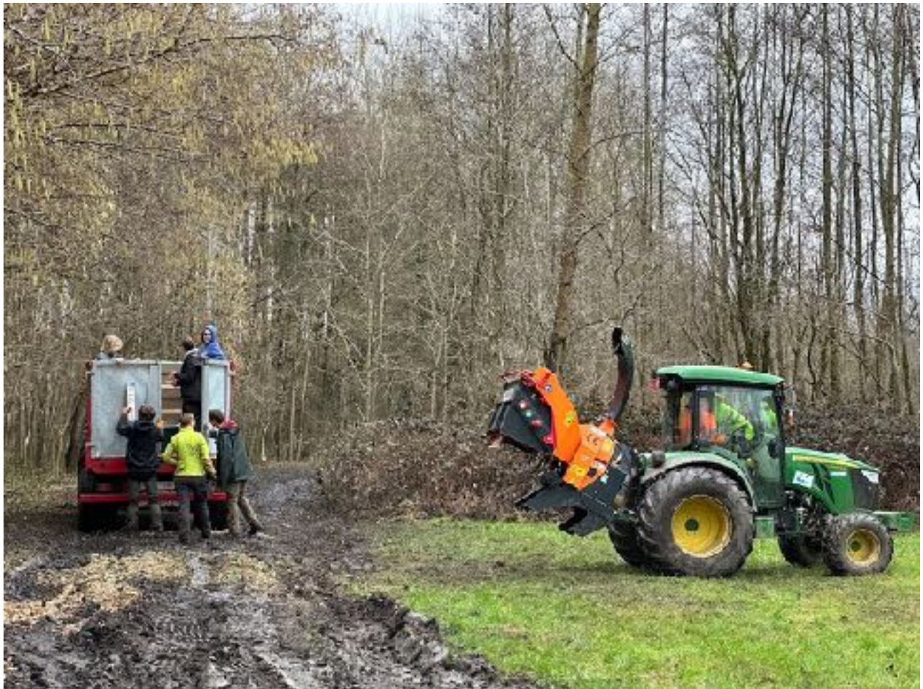
Foto: Werkdag in het Silsombos