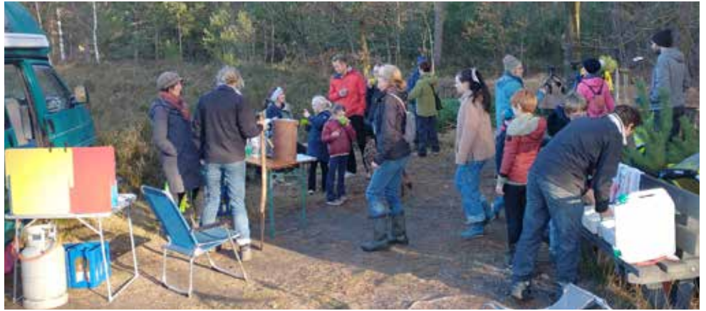
Gezellige drukte bij de kerstboomactie

Op Kerkeheide is er weer hard gewerkt in september om verbossing van de heidevegetatie te gaan. Eind augustus werd voor de tweede keer dit jaar met schapen een stootbegrazing uitgevoerd. Ondanks de grote honger van de kudde schade, slaagden ze er niet in alle boomopslag weg te werken. Daarom werd op zaterdag 16 september een werkdag gehouden om de wat grotere jonge boompjes (jonge berken, vogelkers, en den) individueel uit de heidestukken te halen. Naast de vrijwilligers van de kern hielp ook de beheersploeg van Natuurpunt een aantal dagen mee. Het resultaat van al dit harde werk is duidelijk zichtbaar op het terrein.