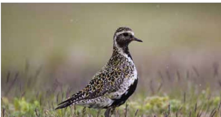
Op de trektelpost van de Hellekens in Herentals sneuvelde weer een aantal dagrecords: op 6/10 vlogen er 391 sizen over, op 14/10 386 aalscholvers en 213 kneuen en op 1/11 128 goudplevieren .