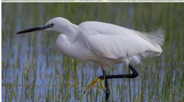
Op 21/10 vloog er een kleine zilverreiger over de Hellekens in Herentals (TSL).