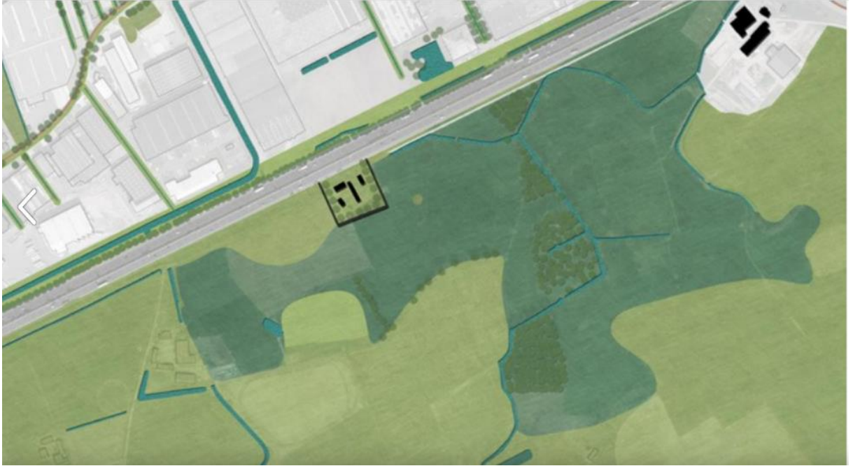
Figuur uit publicatie Leiedal “De Gaverbeek. Twee mondingen, vele gezichten, één toekomst”