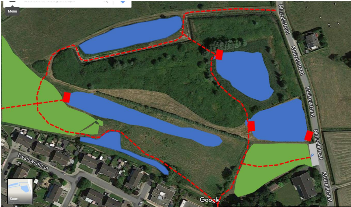
Suggestie inrichting nabij 't Stroomke.