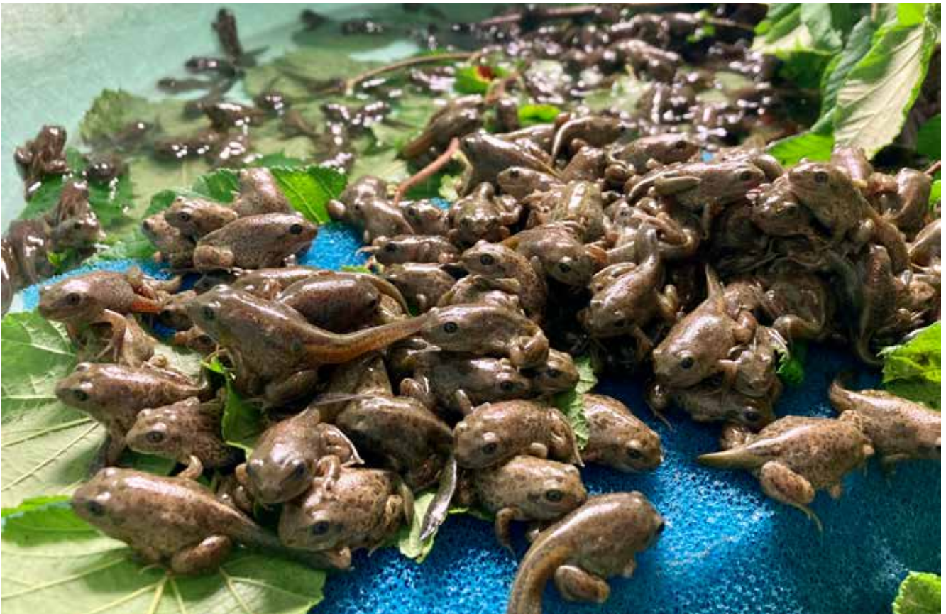
Figuur 4. Juveniele Knoflookpadden in de eindfase van de metamorfose in het Onderzoekscentrum voor Aquatische Fauna (INBO). Voor deze soort wordt gekozen om zowel larven als juvenielen uit te zetten om de kans op een succesvolle translocatie te vergroten.

In 2019 werden larven verzameld in vijf Vlaamse, vijf Waalse en twee Nederlandse populaties. Deze groeiden in gevangenschap op tot volwassen Vroedmeesterpadden ( Figuur 5 ). Op basis van hun genetische verwantschap en herkomst werden ze onderverdeeld in zes kweekgroepen (Auwerx et al. 2021). Sinds 2021 worden hun nakomelingen jaarlijks uitgezet onder de vorm van vier bijplaatsingen, twee geassisteerde herkoloniaties en drie herintroducties. Hierbij wordt telkens een optimale menging van de kweekgroepen beoogd.