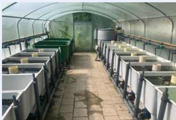
Figuur 6. Voorbeeld van de kweekinfrastructuur in het Onderzoekscentrum voor Aquatische Fauna (INBO). Elk van de waterbakken heeft een inhoud van 250 liter. Het aquacultuursysteem kan zowel zelfstandig draaien door middel van recirculatie, als aangesloten worden op doorstromend bronwater.

gespecialiseerde infrastructuur nodig. Het kweken is arbeidsintensief en de kwaliteit hangt af van elk van de vele stappen in het kweekproces. Daarnaast is ook een nauwgezette gezondheidsscreening van de dieren noodzakelijk. INBO heeft in het Onderzoekscentrum voor Aquatische Fauna ervaring opgebouwd met de ex situ kweek en opgroei van de bovenvermelde soorten amfibieën en voert de huidige conservatie-translocaties uit in opdracht van het ANB (Figuur 6).