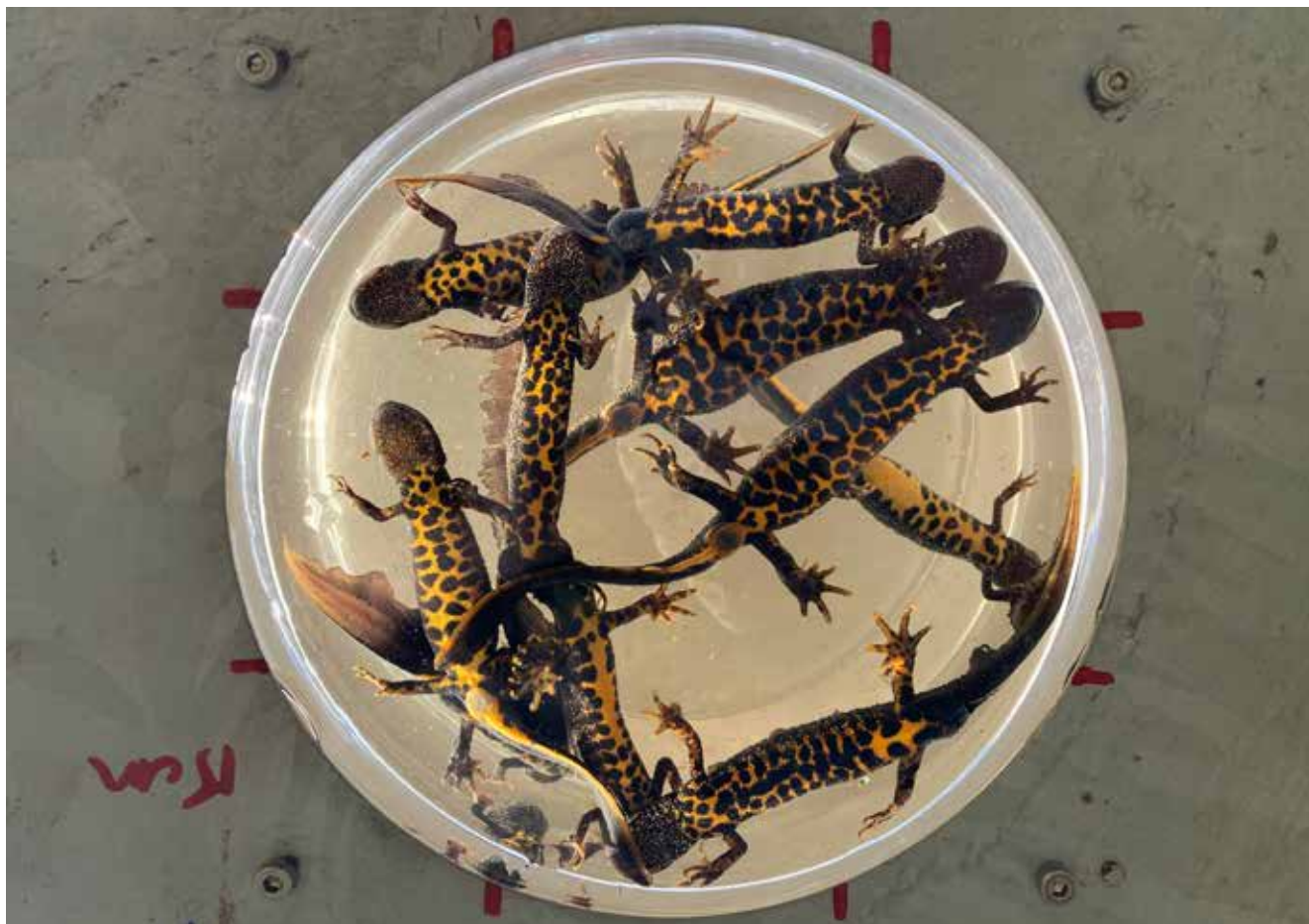
Figuur 2. Met behulp van de salamandertafel (Van de Poel et al. 2017) wordt monitoring eenvoudiger. De buikpatronen van adulte Kamsalamanders zijn stabiel en kunnen door software gemakkelijk herkend worden. Met deze informatie kunnen populatieschattingen berekend worden.

Vlaanderen uitgevoerde translocaties is voornamelijk enkel voor de rugstreeppadpopulatie van het Noordelijk Eiland gebeurd. Voor de lopende (her)introductions is een genetische opvolging wel voorzien.