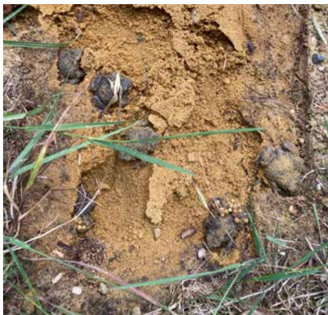
Figuur 5. Adulte Vroedmeesterpadden uit een kweekgroep in het Onderzoekscentrum voor Aquatische Fauna (INBO). Drie van de zes dieren dragen eieren.