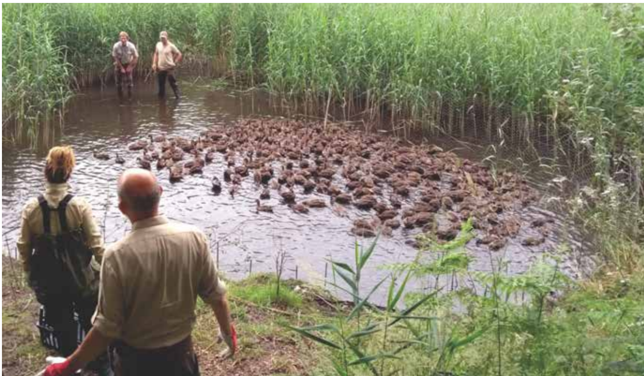
Natuurinspectie in actie: het afvangen van illegaal uitgezette wilde eenden.