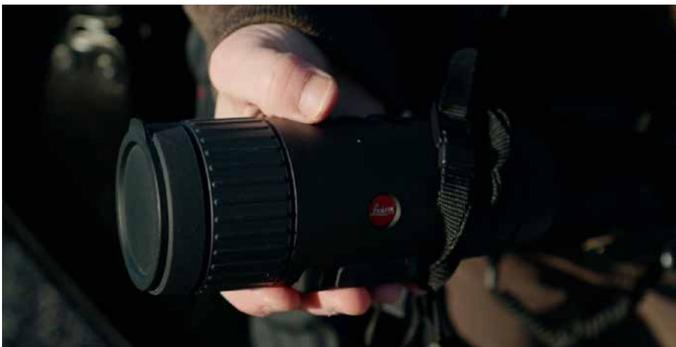
Met warmtebeeldkijkers kunnen natuurinspecteurs 's nachts mensen opsporen.