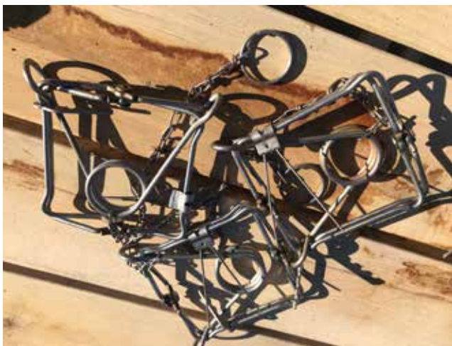
Bij het gebruik van illegale middelen zoals gifereien, klemmen (zoals deze conibearklemmen) of stroppen, grijpen natuurinspecteurs in omdat er ook menselijke slachtoffers kunnen vallen.

Natuurinspecteur K. heeft zich onder andere verdiept in het vermogensvoordeel bij natuurmisdriften. Het vermogensvoordeel is het voordeel in vermogen dat je haalt uit het feit dat je als overtreder een misdrijf pleegt. Natuurinspecteur K.: 'Wij berekenen als inspectiedienst wat het precieze vermogensvoordeel is. Dat voordeel kan opgenomen worden in het pv, zodat de rechtbank de strafbepaling mee kan laten hangen van wat de dader verschuldigd is aan de gemeenschap. Bij illegale ontbossing kunnen er bijvoorbeeld verschillende vermogensvoordelen zijn. Heeft de dader geen boscompensatie moeten betalen, dan nemen we dat standaard op in het pv. Wanneer de dader de grond na de ontbossing als landbouwgrond gebruikt (als die