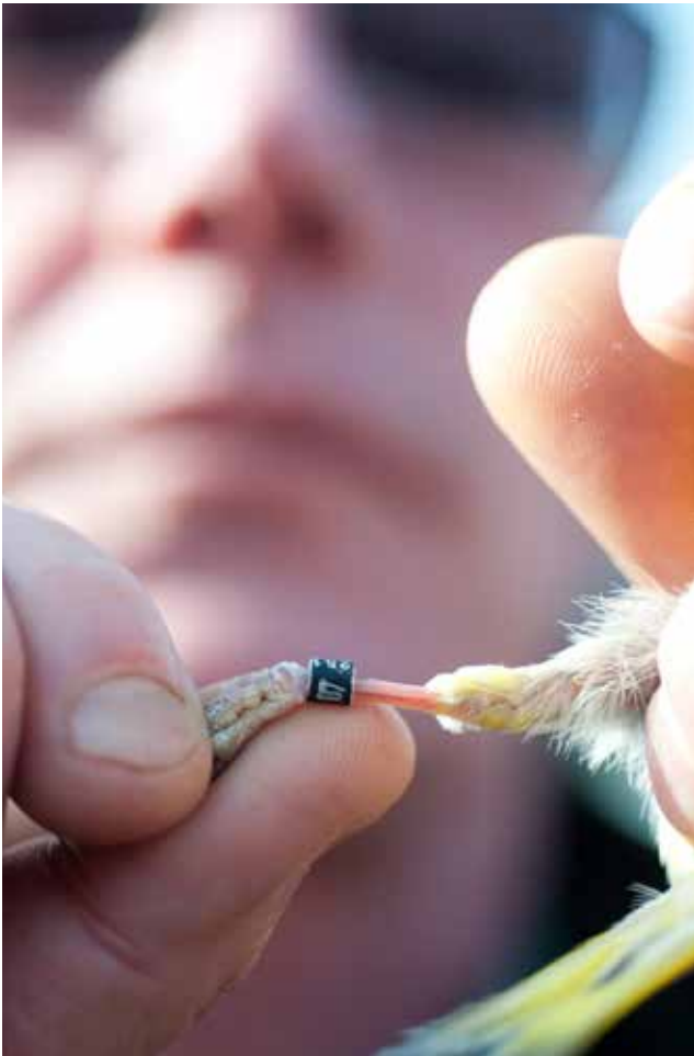
Illegale vogelvangst en vogelpootringfraude opsporen is een van de misdrijven waar de natuurinspectie vaak mee te maken krijgt.

Het uitoefenen van toezicht, opvolgen van meldingen, organiseren van gecontroleerde acties, opmaken van pv's: het takenpakket van een natuurinspecteur is veelomvattend. Bovendien is een werkdag vaak onvoorspelbaar, waardoor natuurinspecteurs veel flexibiliteit aan de dag moeten leggen.