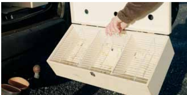
Natuurinspecteurs beschikken onder andere over vogelkooien om gefraudeerde vogels te vangen en mee te nemen.

Ook jachthandhaving is een deel van het takenpakket van natuurinspecteurs. Daarbij gaan ze na of jagers zich houden aan de regelgeving. De jachthandhaving is elk seizoen anders. Tijdens het voorjaar houden jagers predatoren zoals Zwarte kraaien en Eksters onder controle met perfect legale methodes zoals trechtere vallen en Larsenkooien. Maar wanneer er wordt overgestapt naar illegale middelen, zoals het gebruiken van gifreien, klemmen of stroppen, dan grijpen natuurinspecteurs in omdat er ook menselijke slachtoffers kunnen vallen. In de maanden mei en juni lopen er jonge Vossen rond en dan durft men 's nachts weleens illegaal op Vossen schieten. Juli en augustus zijn dan weer populaire maanden voor het illegaal uitzetten van Wilde eenden. In september opent de jacht op Patrijzen. Als er illegaal Patrijzen worden uitgezet, dan gebeurt dat meestal in de nacht voorafgaand aan de jacht. Dat scenario is ook van toepassing op Fazanten, maar pas vanaf midden oktober.