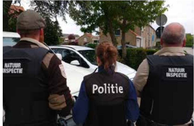
De natuurinspectie werkt vaak samen met de federale politie, bijvoorbeeld bij recherchewerk rond georganiseerde vogelhandel.

Tot slot wordt de wetgeving steeds complexer. Natuurinspecteur J.: 'Het is misschien eigen aan de Belgen, maar onze natuur-overtreders zijn zeer inventief. Omdat de wetgeving zo complex is, wordt er door mensen soms gretig gezocht naar het juiste achterpoortje om alsnog een natuurvergunning in handen te krijgen of om hun zin door te drijven zonder vergunning. Om die achterpoortjes in de wet te dichtten, worden decreten en uitvoeringsbesluiten aangepast of niet handhaafbaar gemaakt. De mazen van het handhavingsnet worden daardoor nauwer, maar