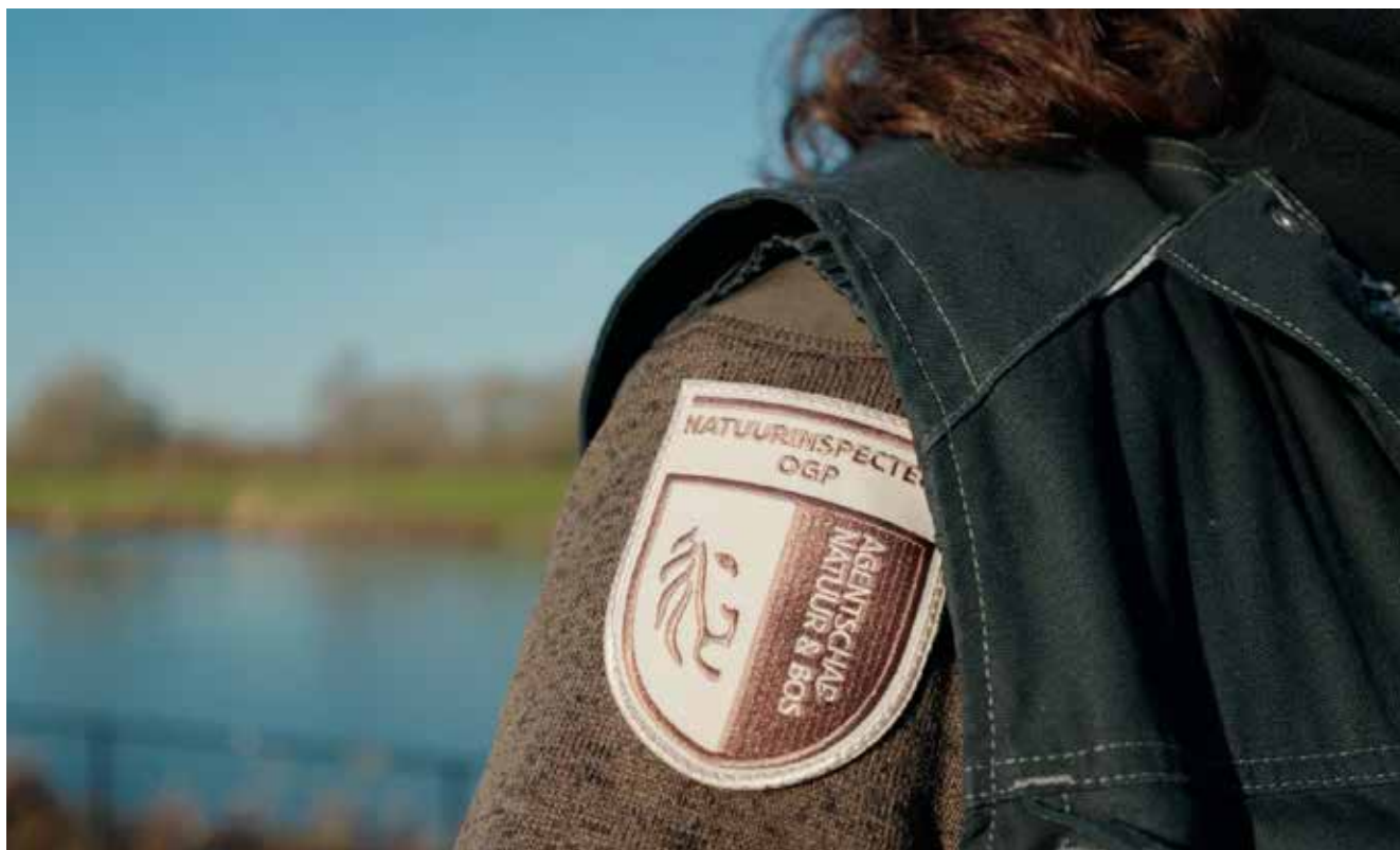
Natuurinspecteurs dragen hetzelfde bruin/beige uniform als de boswachters, maar dan met een ander wapenschildje op de mouw, waarop hun functie van natuurinspecteur en het logo van de Vlaamse overheid vermeld worden.

overtredingen van hun jachtheer. Bij die ontduubeling kan het opportuun zijn om de faunabeheertaken onder te brengen bij een andere onafhankelijke Vlaamse functie. Daarbij kun je dat deel van het huidige takenpakket van de bijzondere veldwachter opwaarderen. Ook daar zijn er immers noden voor specifieke beheertaken, bijvoorbeeld wat het beheer van Everzwijnen betreft. De scheiding van die twee rollen is een goede zaak en een noodzakelijke voorwaarde voor een structurele doelmatige samenwerking.'