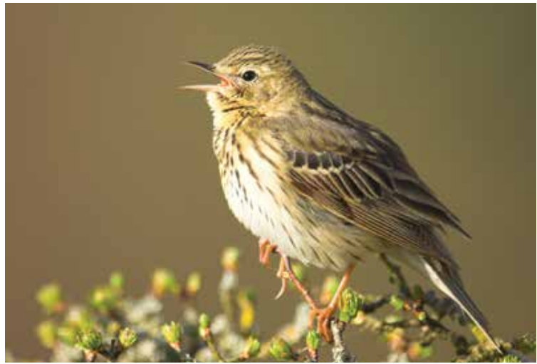
Boven: Vader en dochter zijn hier kind aan huis. Onder: Hier hoor je de boompieper zingen.

vriend vroeg of ik me wilde inzetten om een stukje natuur aan te kopen, om er zo mee voor te zorgen dat dit gebied bewaard zou blijven. Het begon met 1,5 hectare en Natuurpunt beheert hier nu meer dan 200 hectare. Ik zag dit wel zitten en werd dan maar meteen conservator.