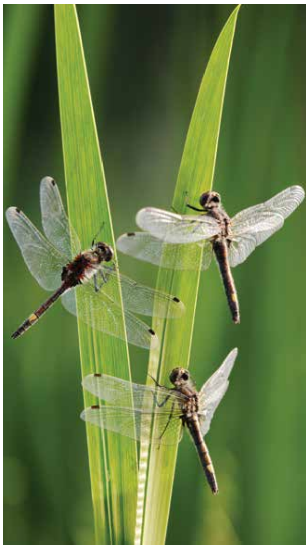
De zeldzame gevlekte witsnuitlibel vliegt hier rond.